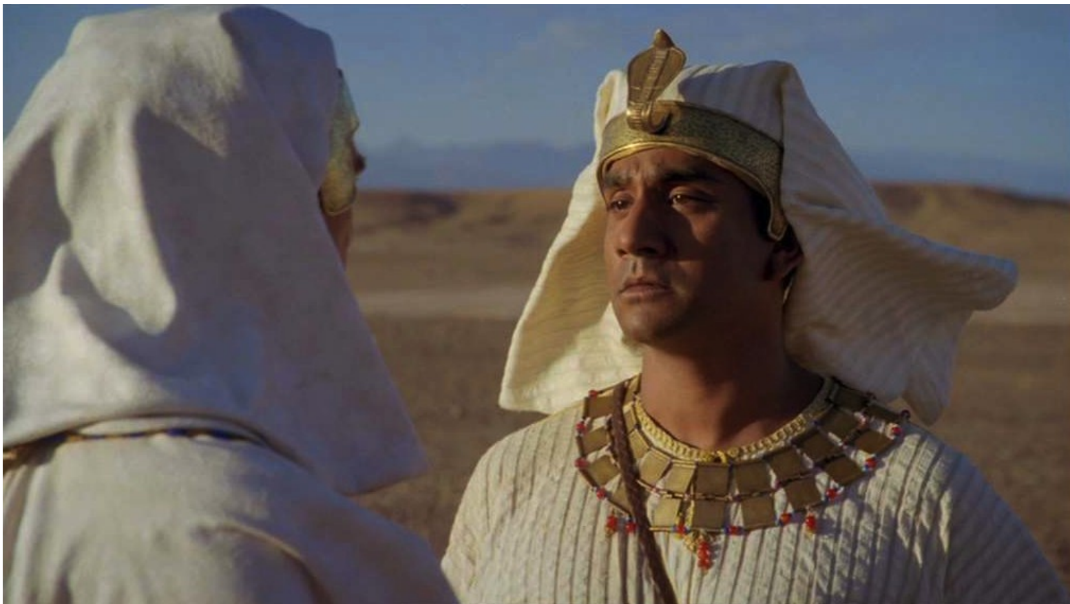
Les Dix Commandements (Dornhelm) : ... au grand désespoir de son frère égyptien Menerith.