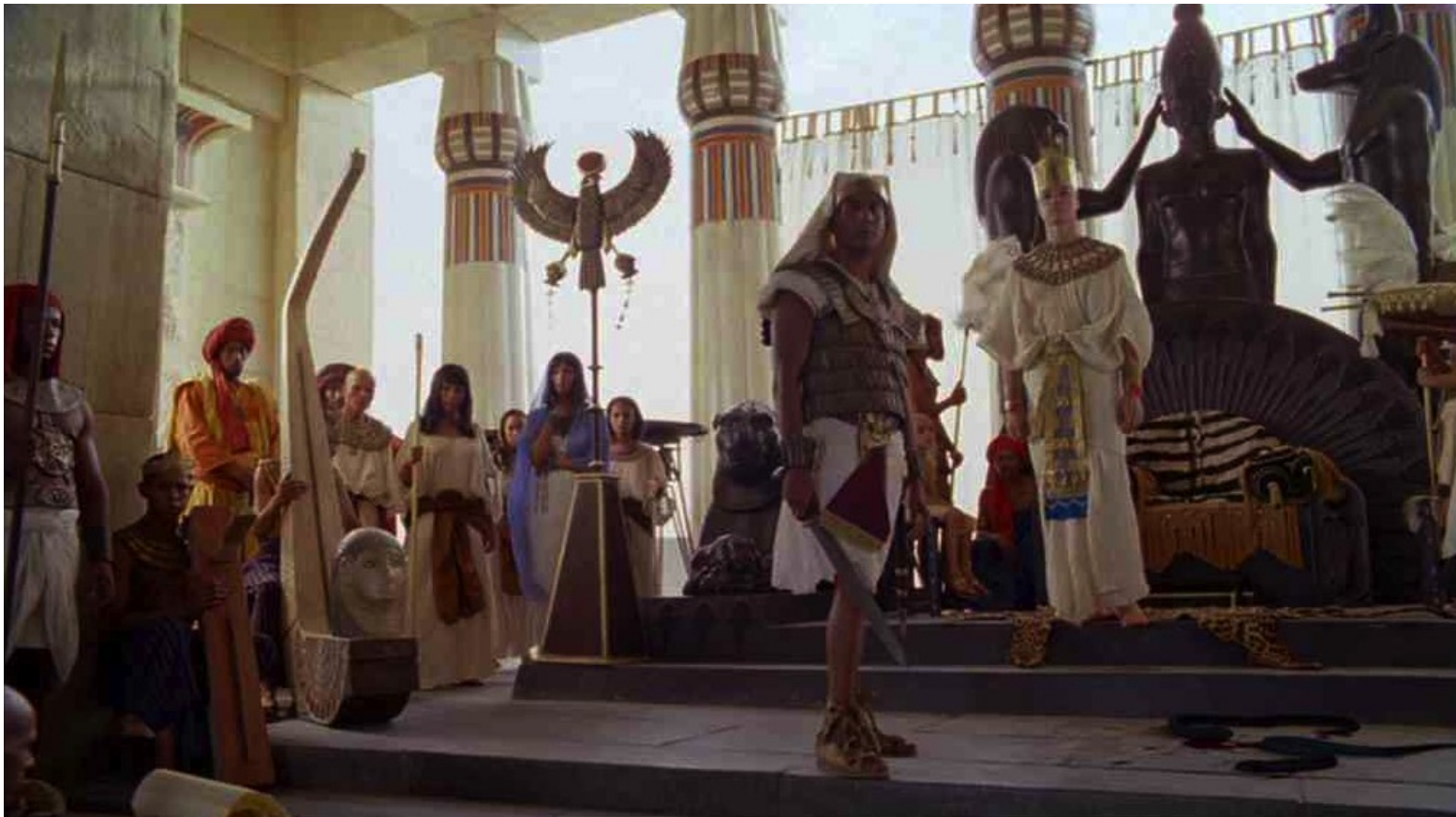
Les Dix Commandements (Dornhelm) : ... à la cour égyptienne...