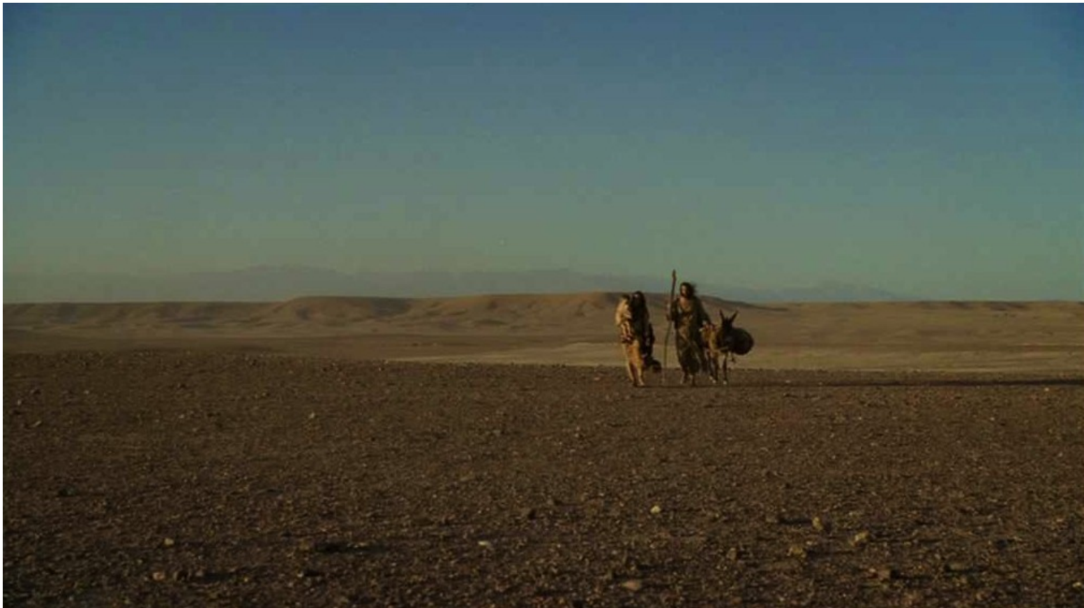
Les Dix Commandements (Dornhelm) : Il partit donc avec sa femme...