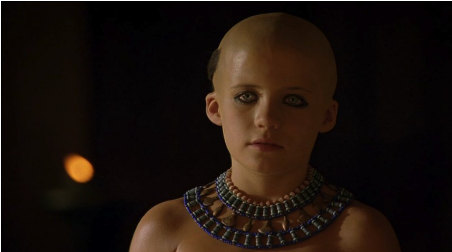
Les Dix Commandements (Dornhelm) : Puis Moïse grandit à la cour,