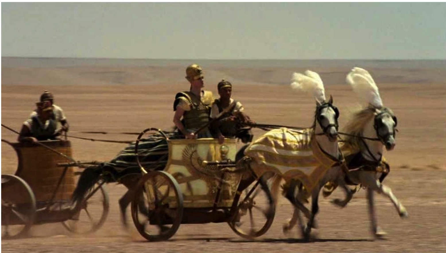
Les Dix Commandements (Dornhelm) : ... et galopa à sa tête.