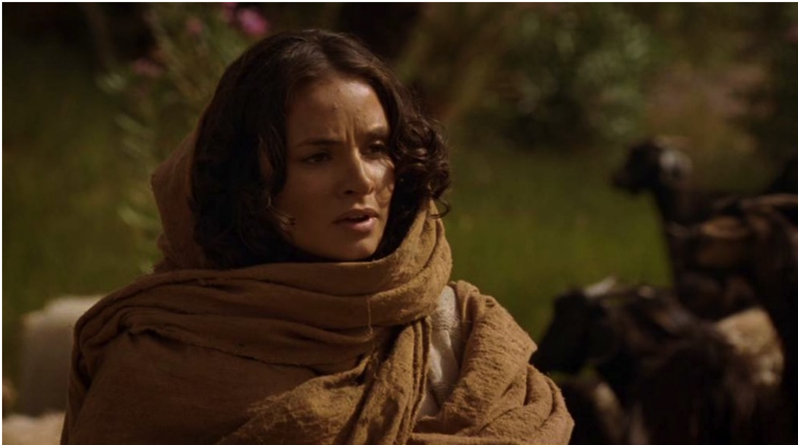
Les Dix Commandements (Dornhelm) : parmi lesquelles la belle Zipporah,