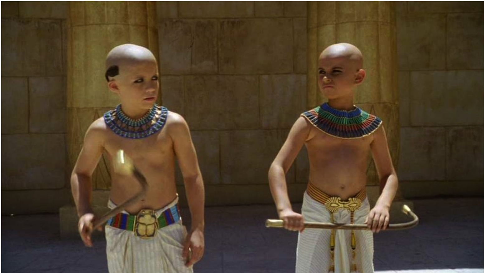
Les Dix Commandements (Dornhelm) : fut élevé avec Menerith (fils de Bithia), son frère par adoption...