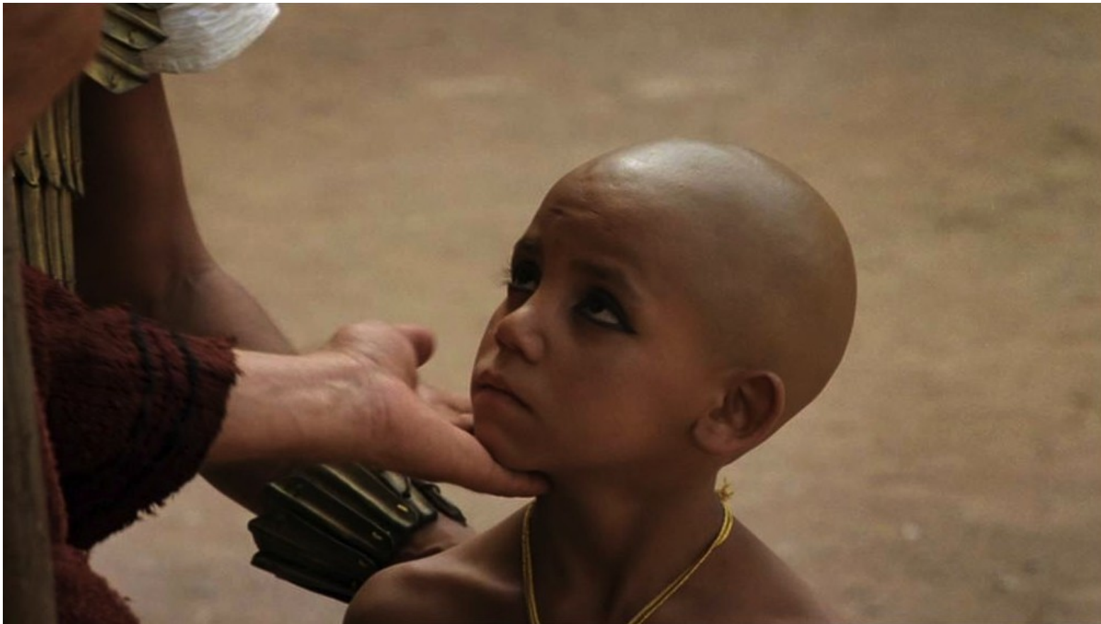
Les Dix Commandements (Dornhelm) : un enfant auquel il vouait un amour passionné ;