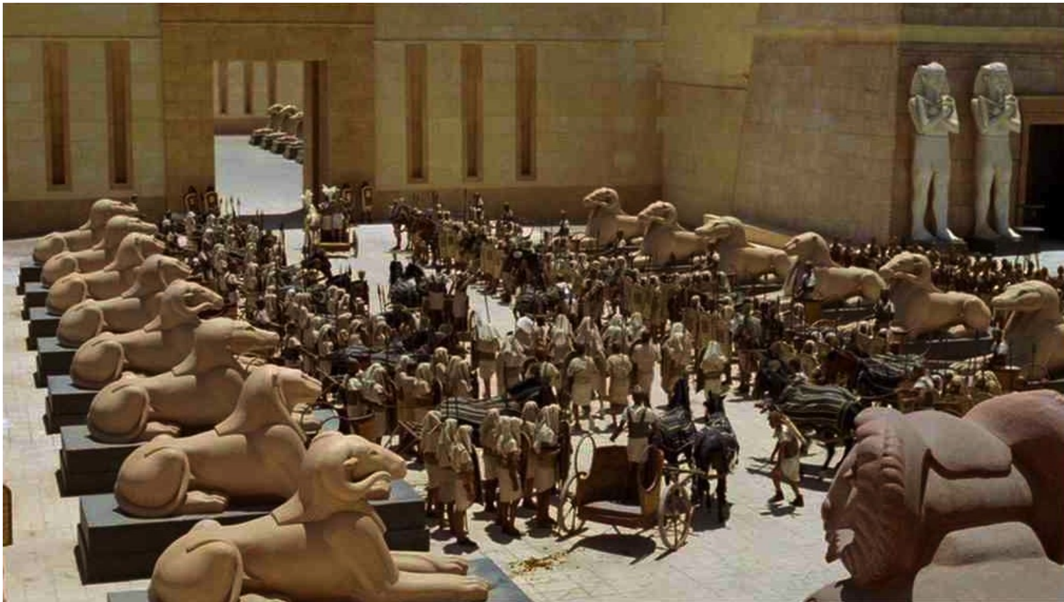
Les Dix Commandements (Dornhelm) : fit sortir son armée...