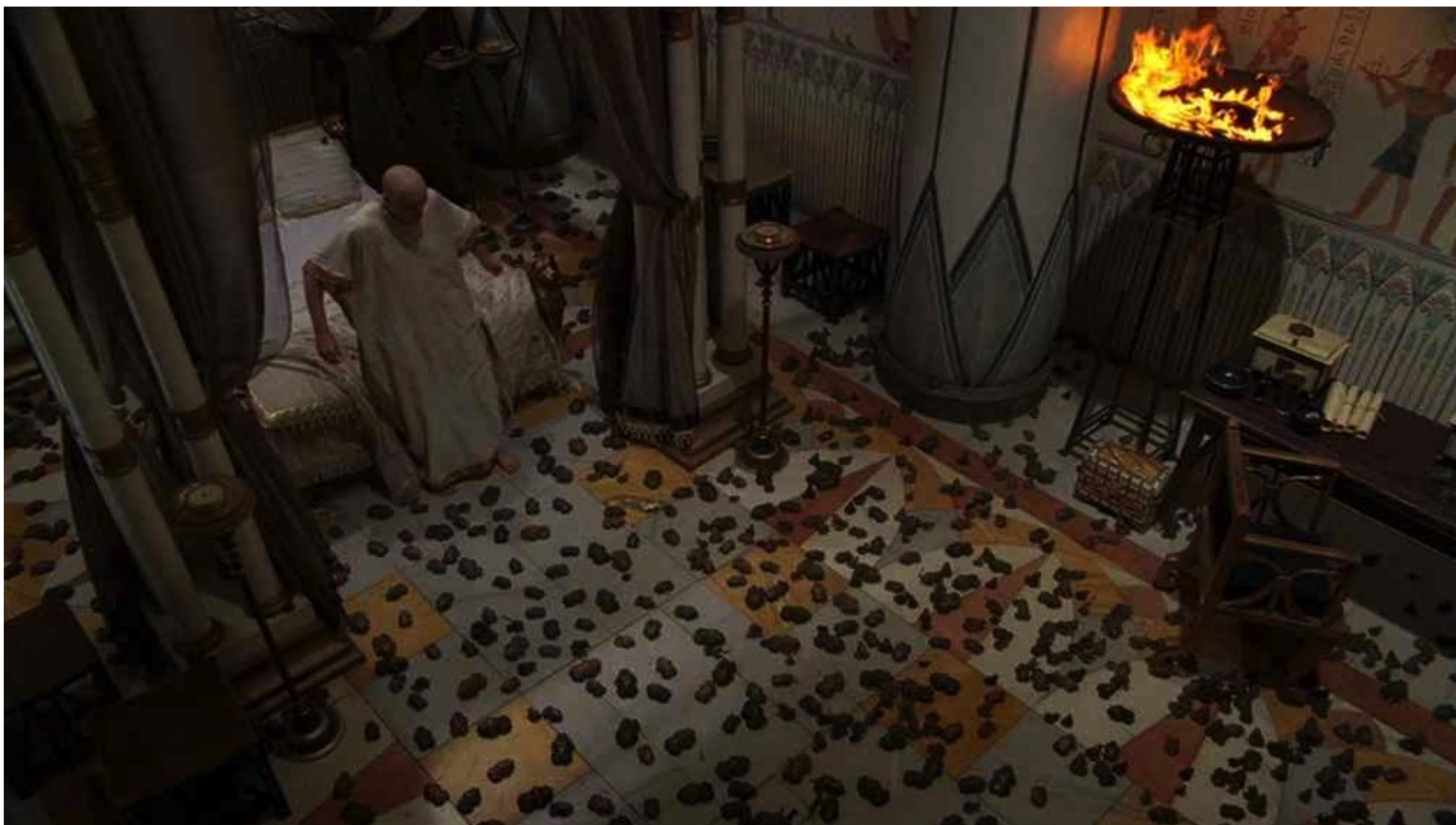
Les Dix Commandements (Dornhelm) : ... et des grenouilles envahirent jusqu'à la chambre de Pharaon.