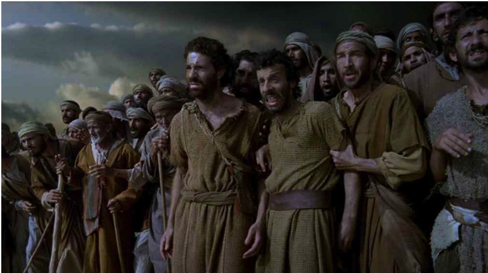
Les Dix Commandements (Dornhelm) : Mais les Hébreux, effrayés, étaient arrivés devant une mer...