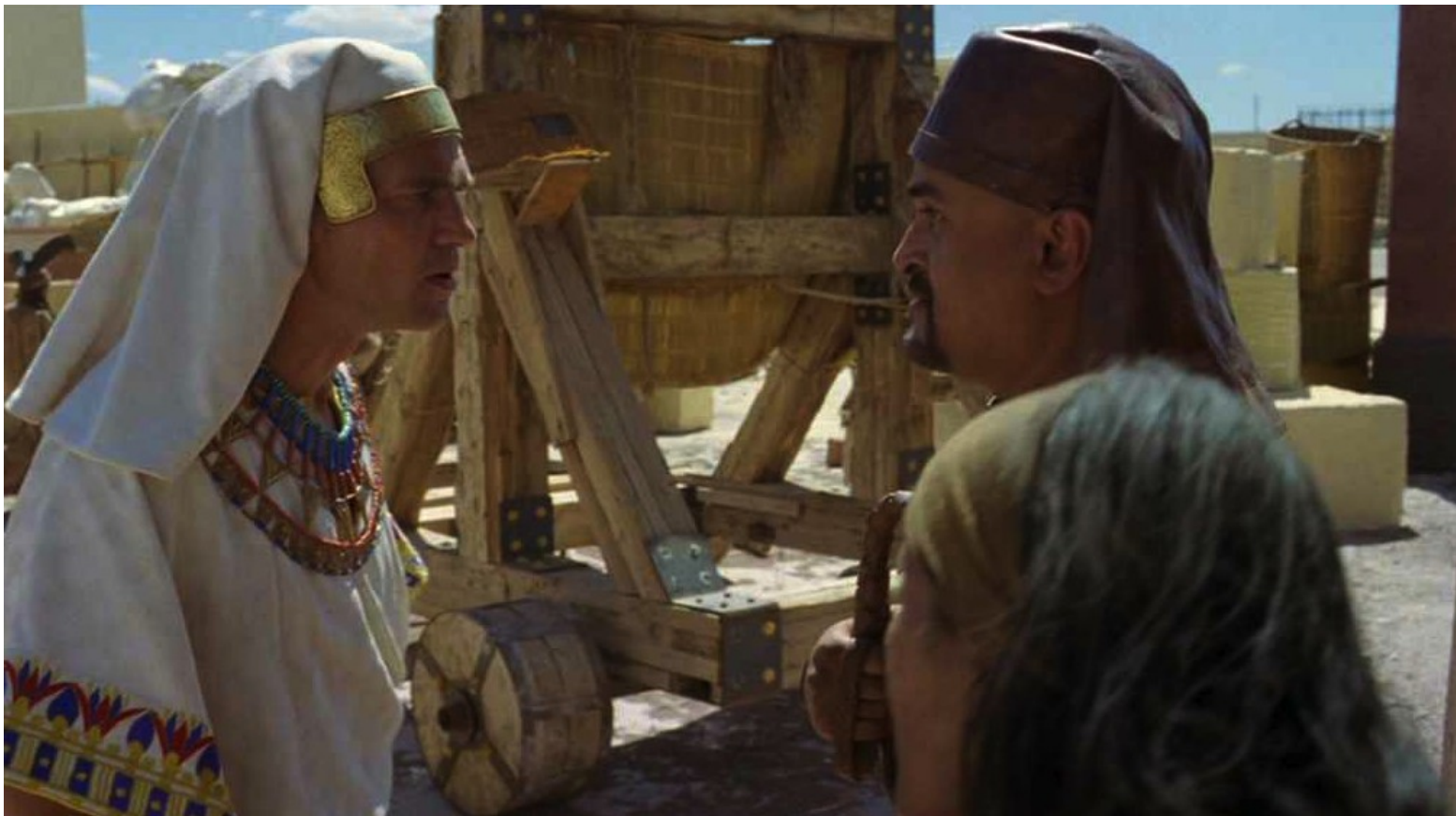
Les Dix Commandements (Dornhelm) : mais il se disputa avec un méchant garde et le tua.