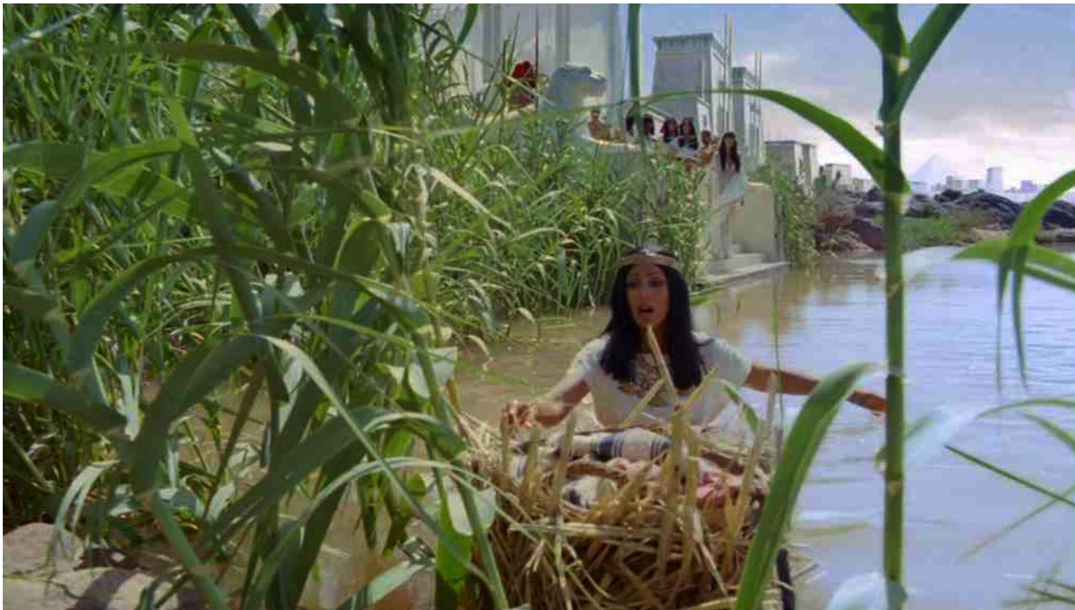
Les Dix Commandements (Dornhelm) : ... qu'une servante alla récupérer :