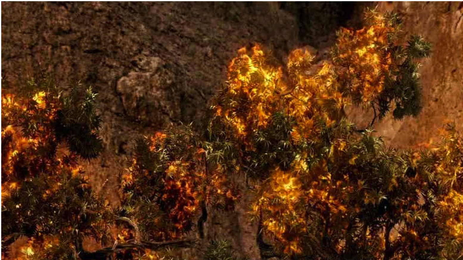
Les Dix Commandements (Dornhelm) : un buisson qui brûlait sans se consumer ; c'était Dieu...