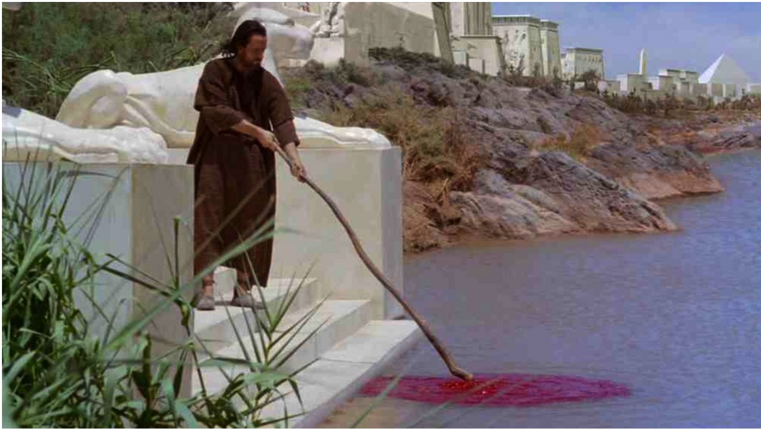
Les Dix Commandements (Dornhelm) : Moïse et Aaron transformèrent les eaux en sang...