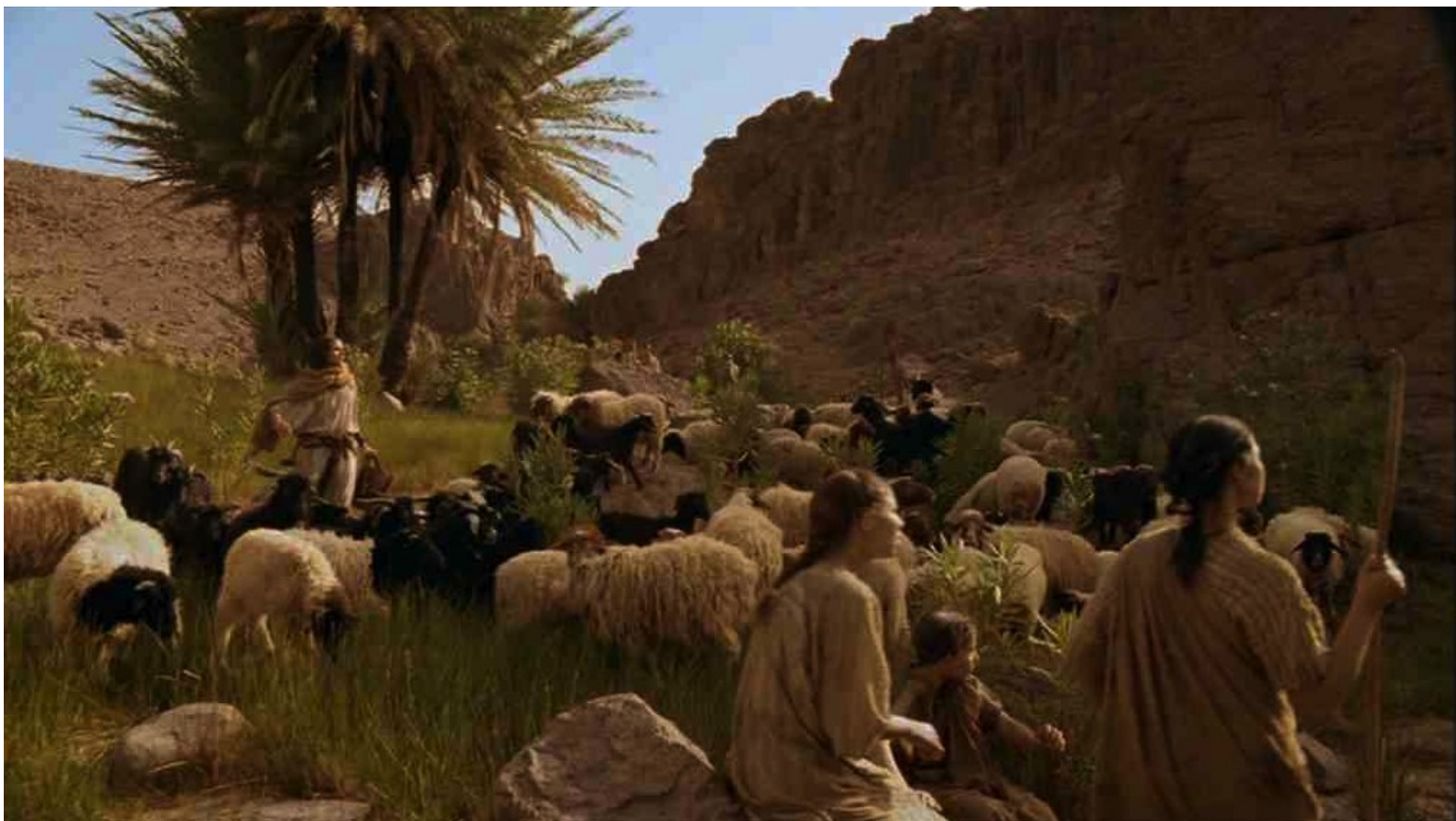
Les Dix Commandements (Dornhelm) : il vit des bergères, filles du grand prêtre de Madian,