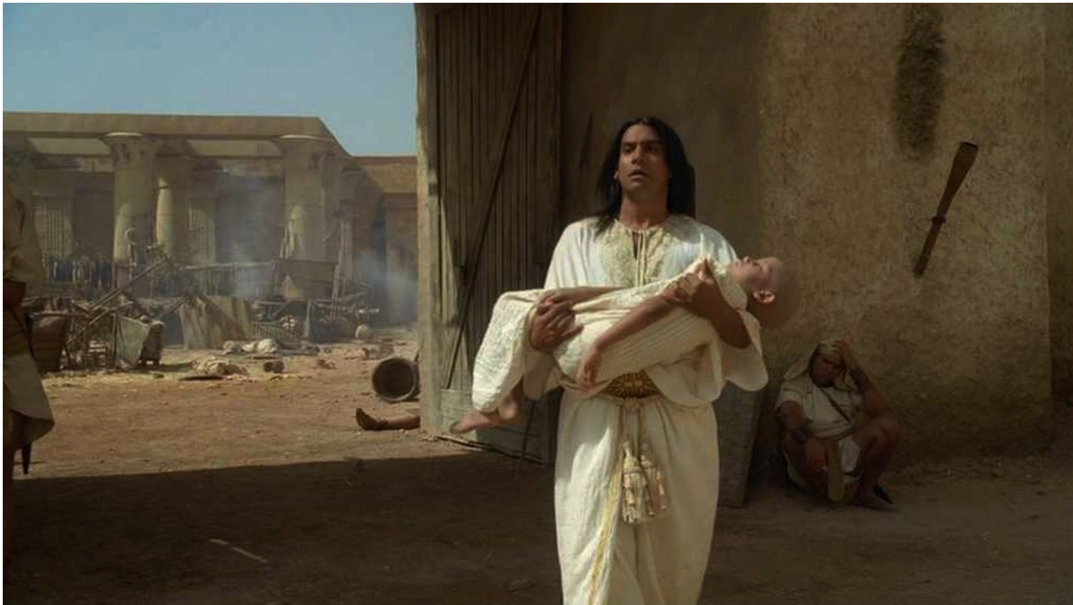
Les Dix Commandements (Dornhelm) : mais, comme tous les premiers nés d'Égypte, il mourut lui aussi,