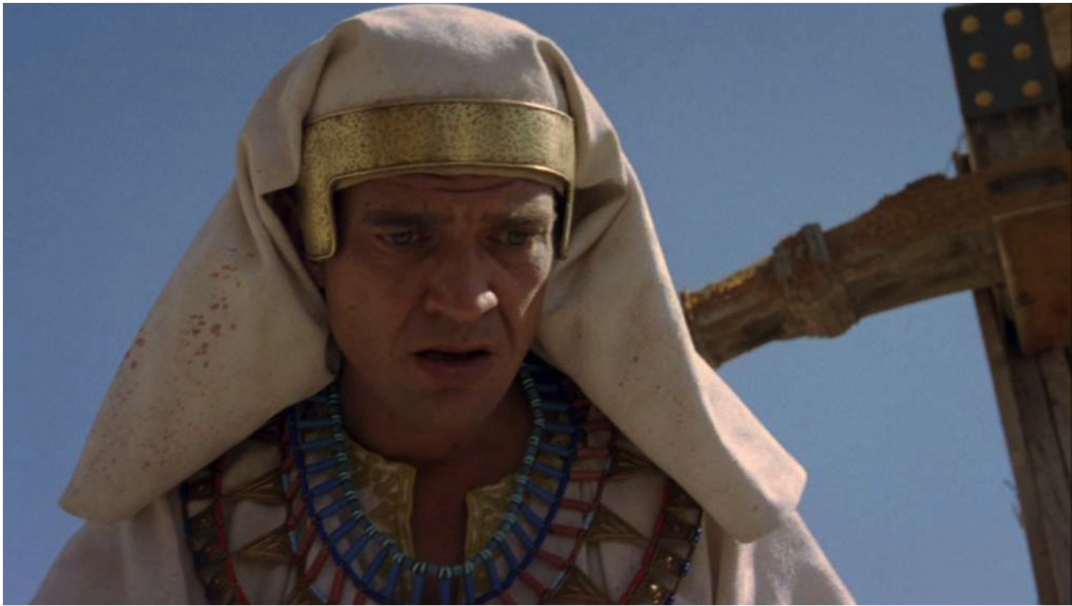
Les Dix Commandements (Dornhelm) : Adulte, il devint un prince égyptien,