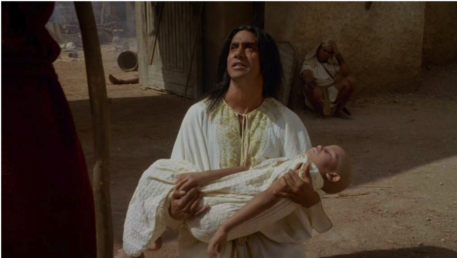
Les Dix Commandements (Dornhelm) : au grand désespoir de son père.