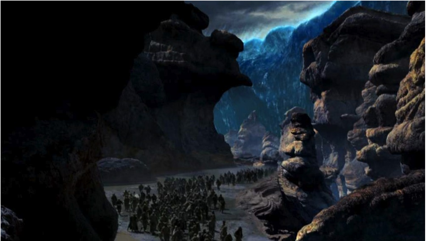
Les Dix Commandements (Dornhelm) : ... entre des murailles d'eaux salées.