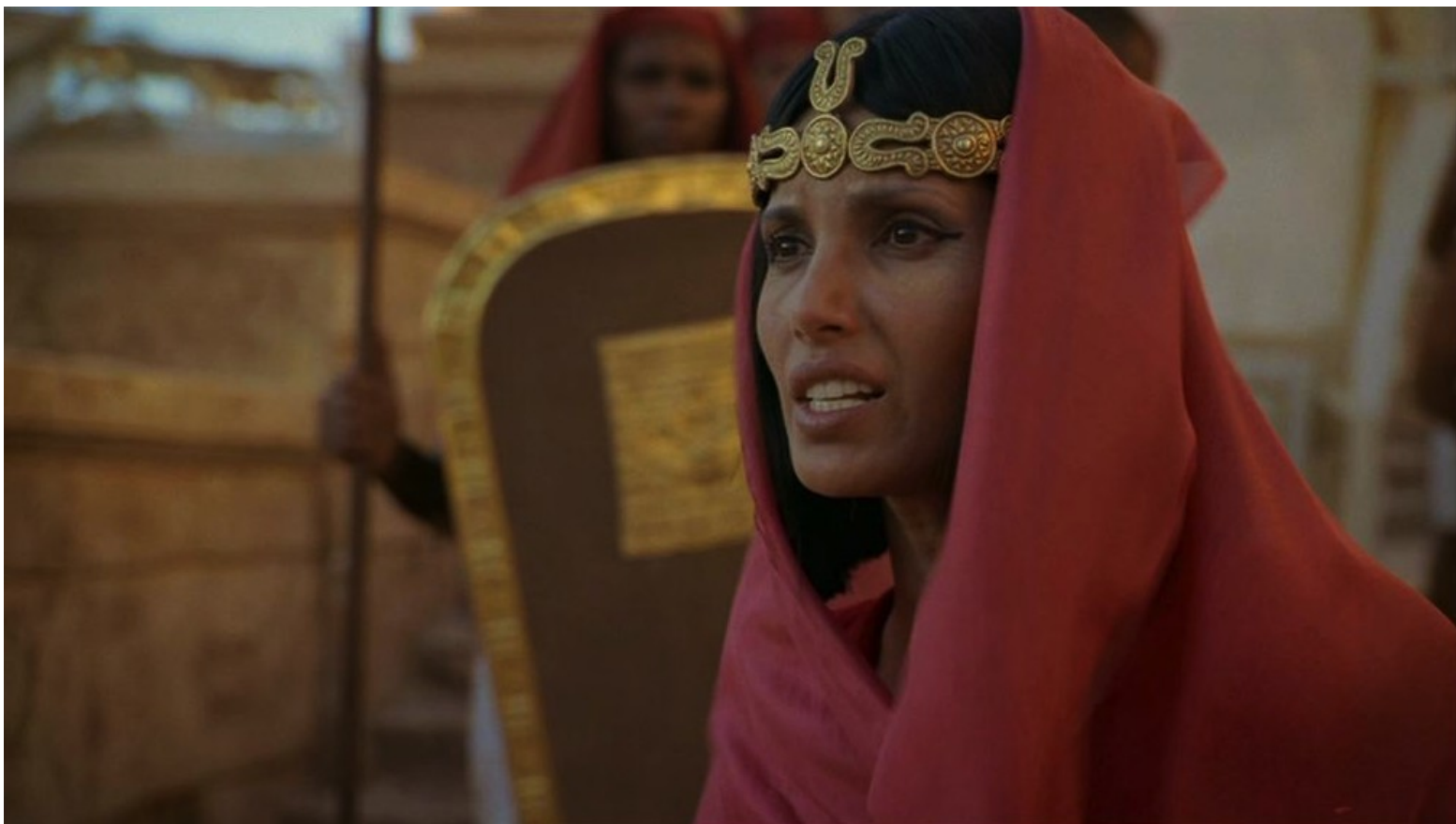
Les Dix Commandements (Dornhelm) : Il retrouva aussi Bithia, sa mère adoptive,