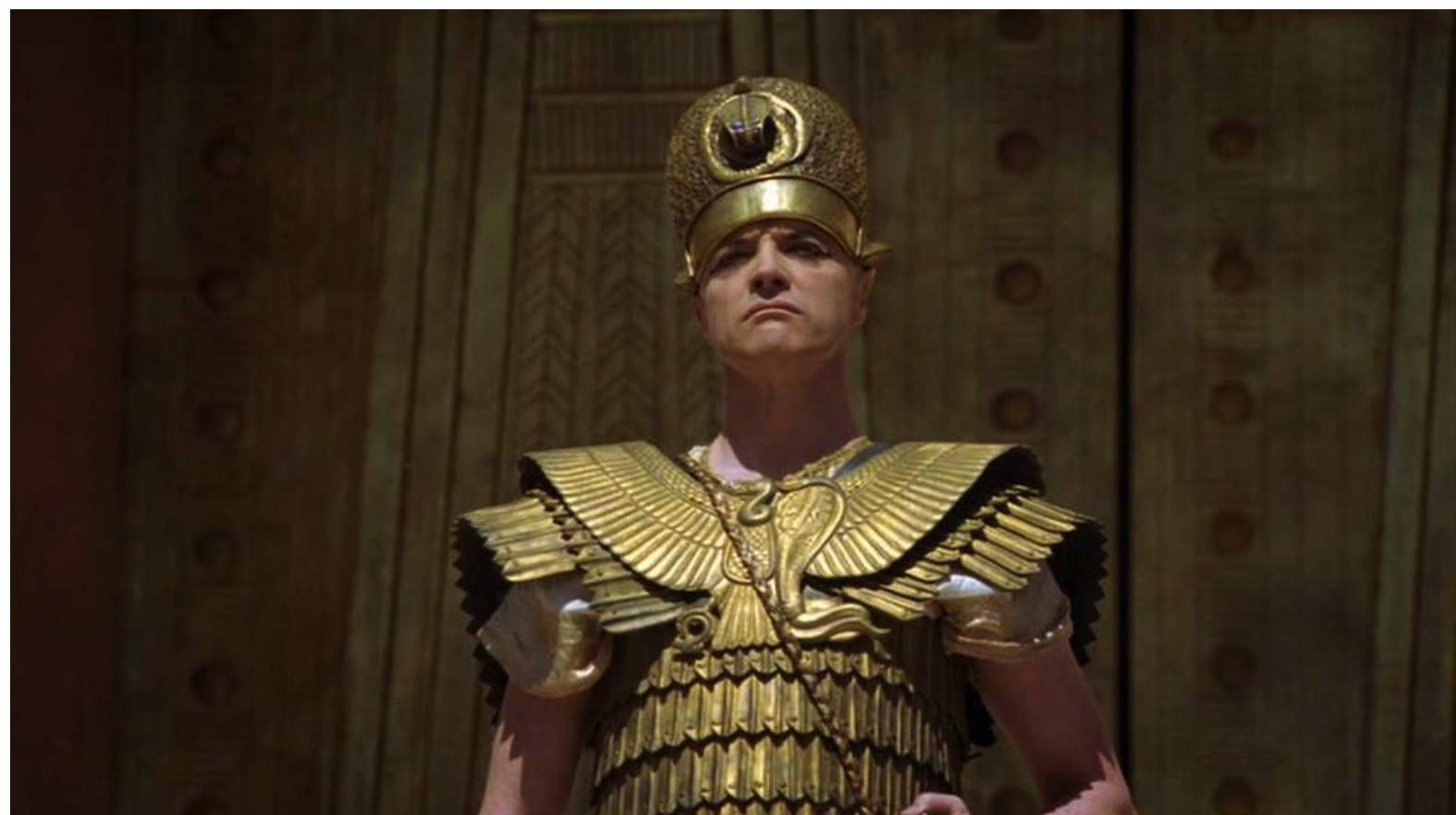
Les Dix Commandements (Dornhelm) : endossa son armure,