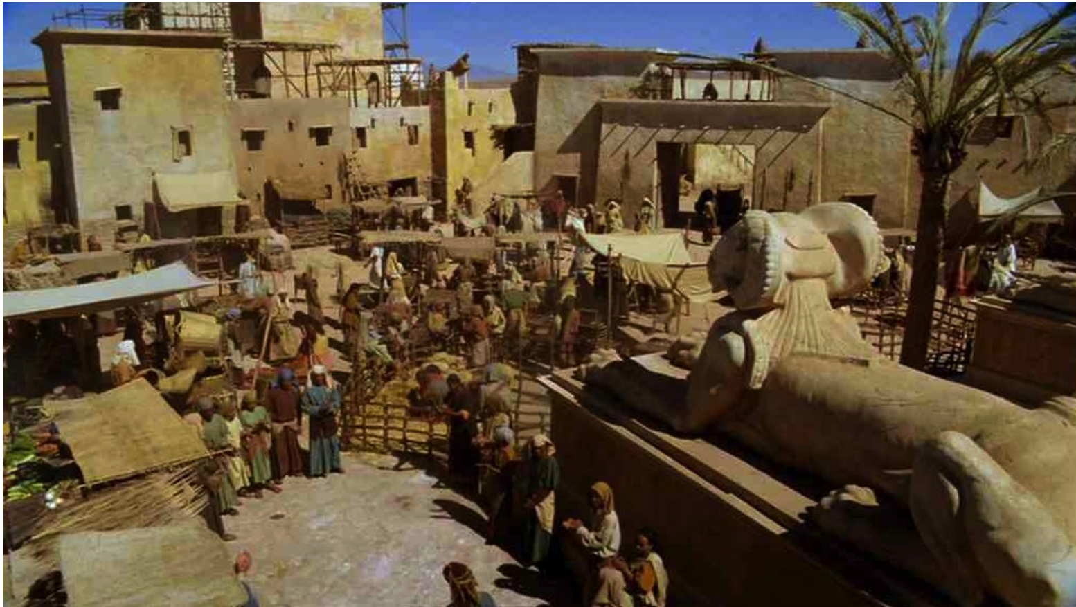
Les Dix Commandements (Dornhelm) : puis il se rendit dans le quartier juif...