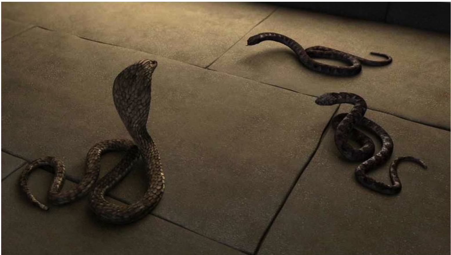
Les Dix Commandements (Dornhelm) : ... les serpents des mages égyptiens.