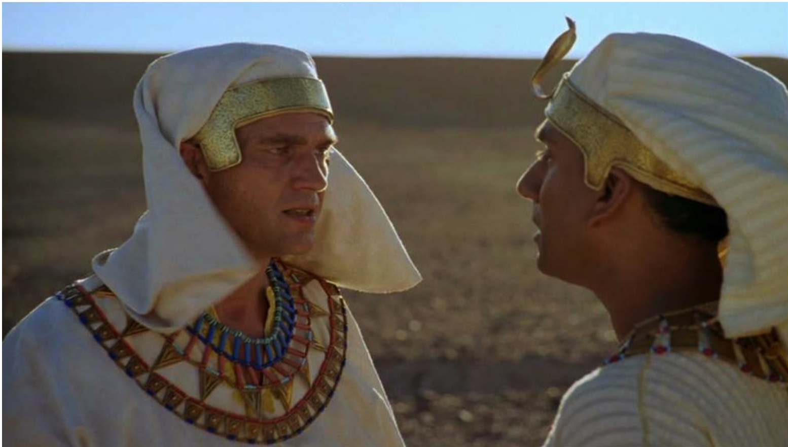
Les Dix Commandements (Dornhelm) : En conséquence, il dut s'enfuir dans le désert...