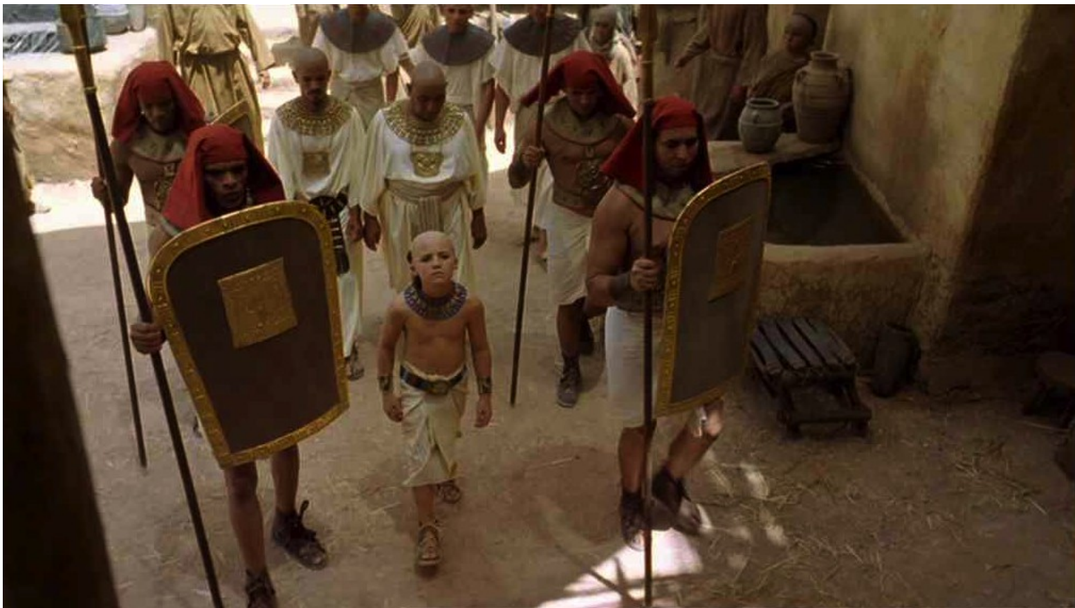
Les Dix Commandements (Dornhelm) : et fut présenté à la famille de sa nourrice (= sa vraie mère).