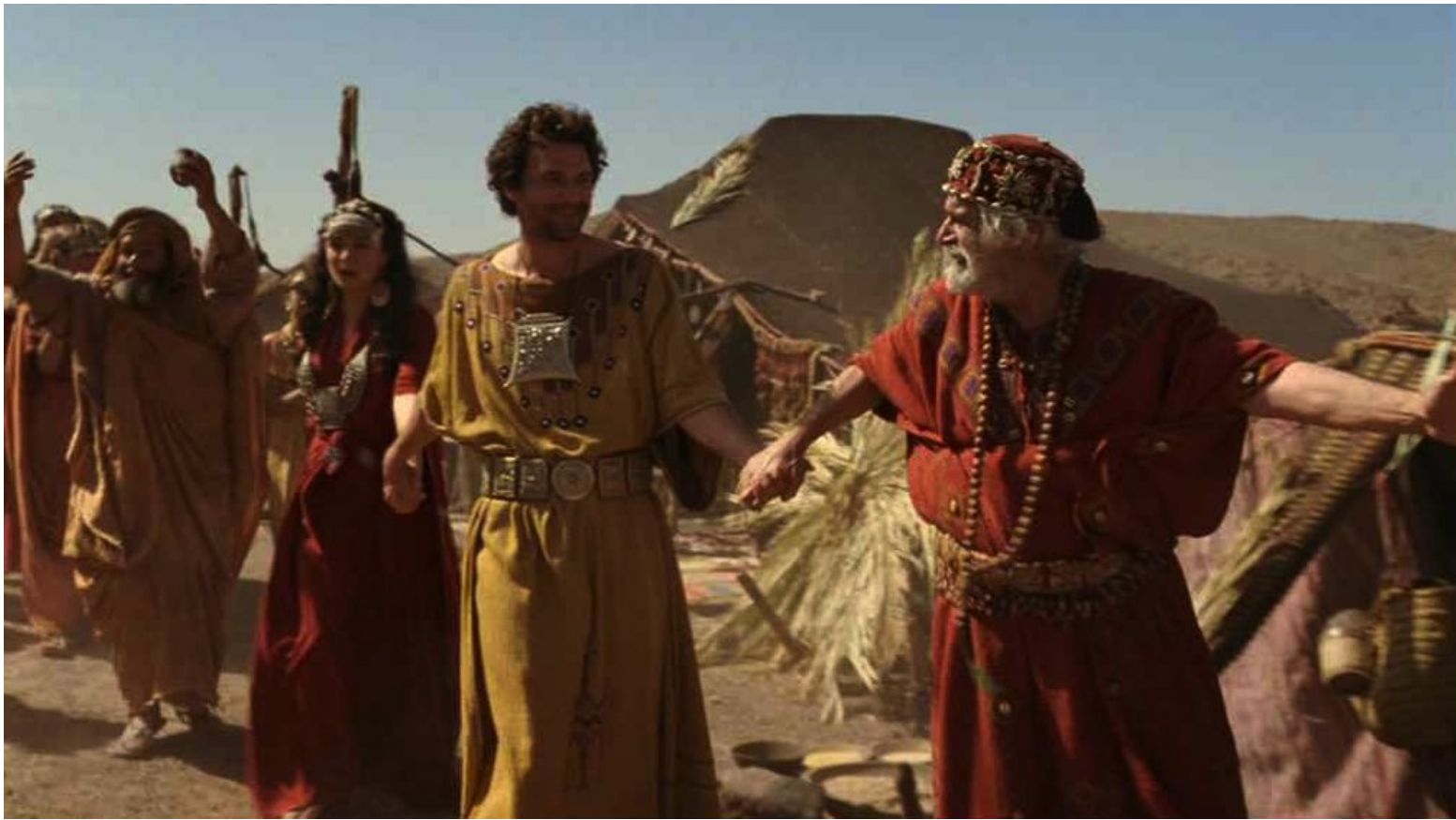
Les Dix Commandements (Dornhelm) : ... donna en mariage à Moïse...