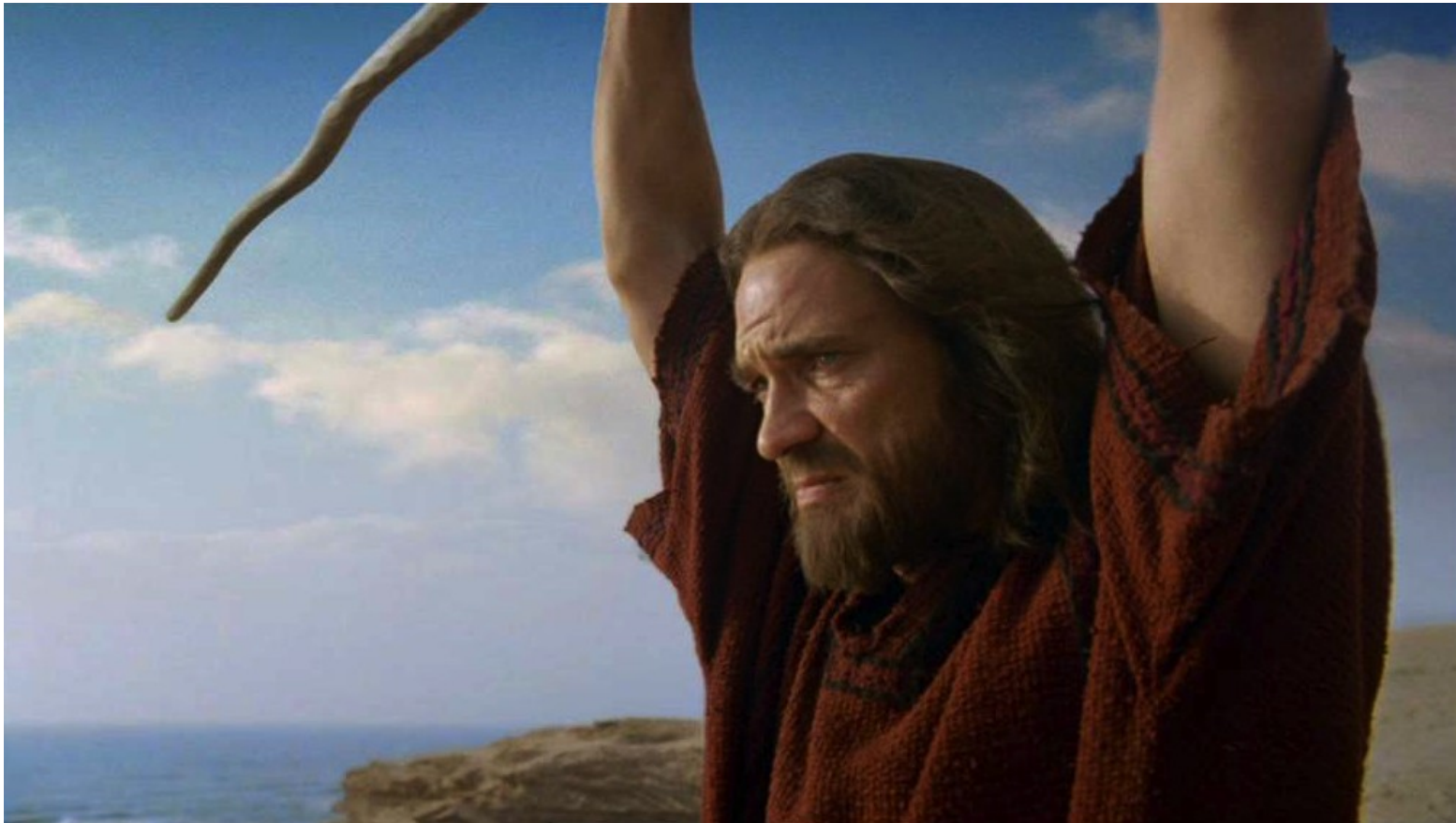
Les Dix Commandements (Dornhelm) : ... dont Moïse ouvrit les flots...