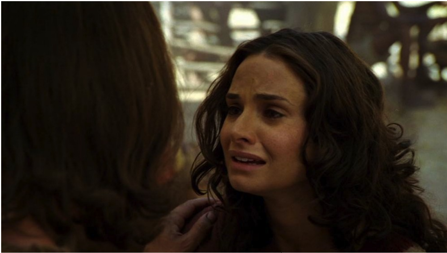
Les Dix Commandements (Dornhelm) : Mais, arrivé en Égypte, il décida de renvoyer Zipporah,