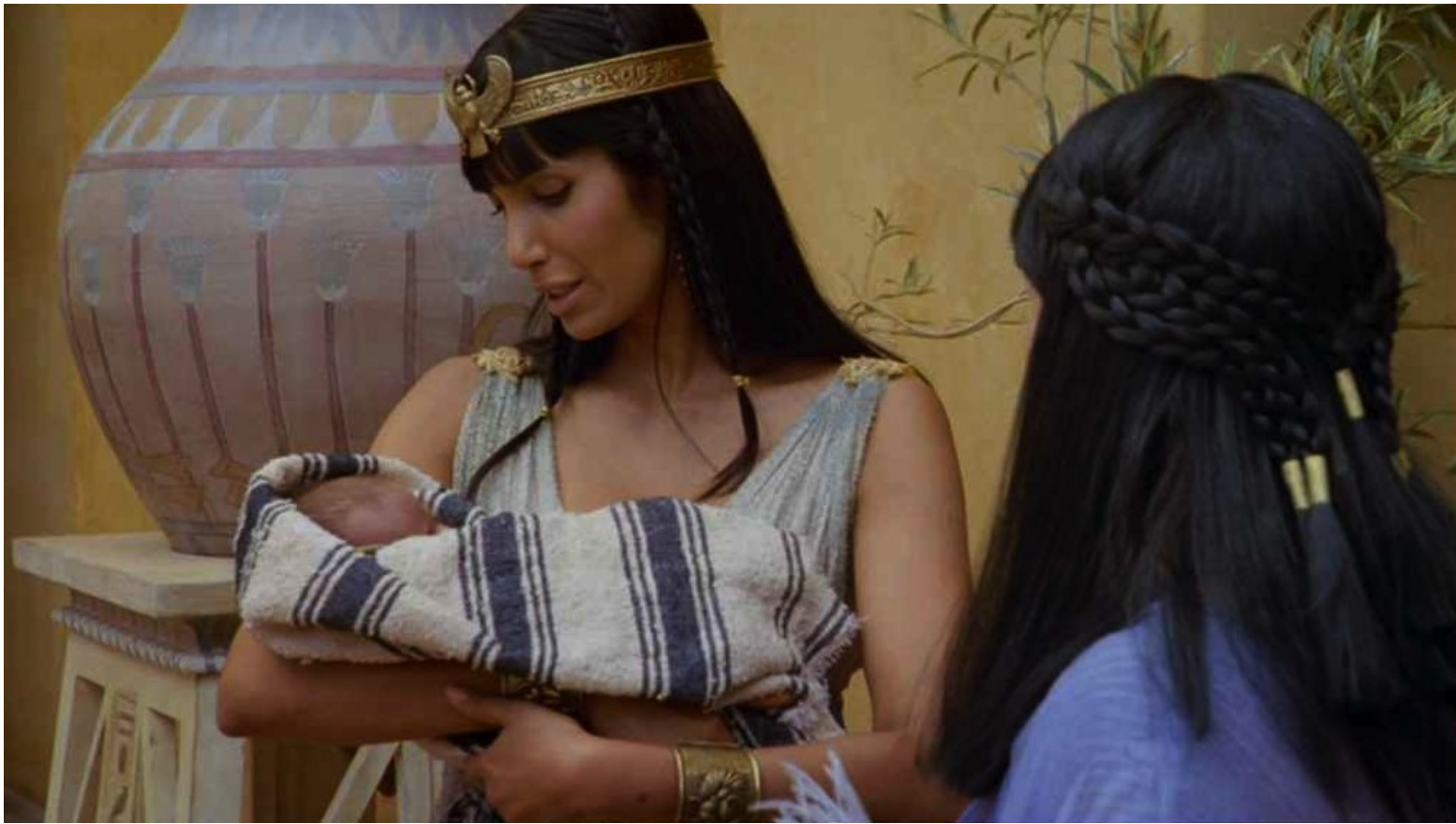
Les Dix Commandements (Dornhelm) : c'était un bébé que la princesse adopta...