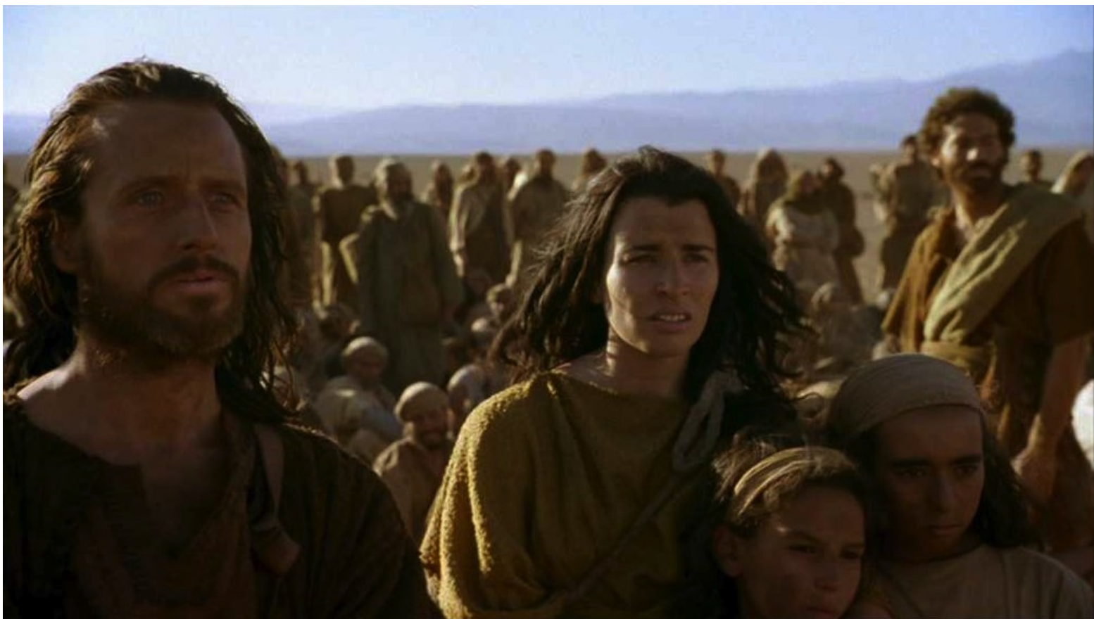
Les Dix Commandements (Dornhelm) : ... secondé par son frère Aaron et sa sœur Myriam.