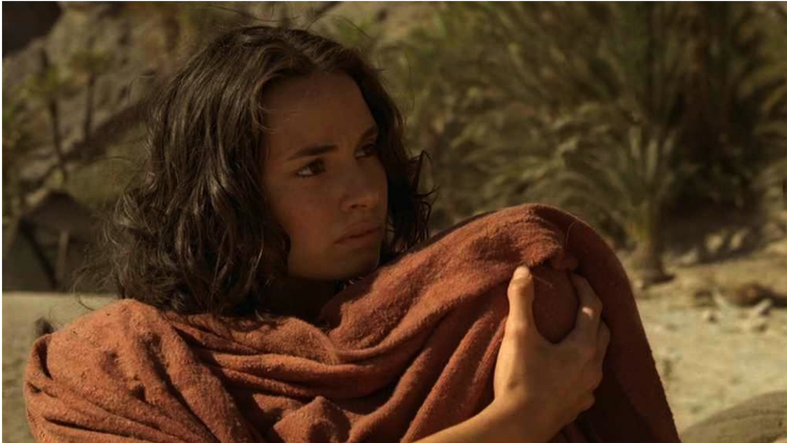
Les Dix Commandements (Dornhelm) : ... et leur bébé.