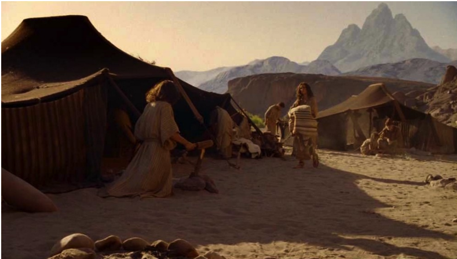
Les Dix Commandements (Dornhelm) : Dès lors, dans leur campement au pied du Mont Horeb,