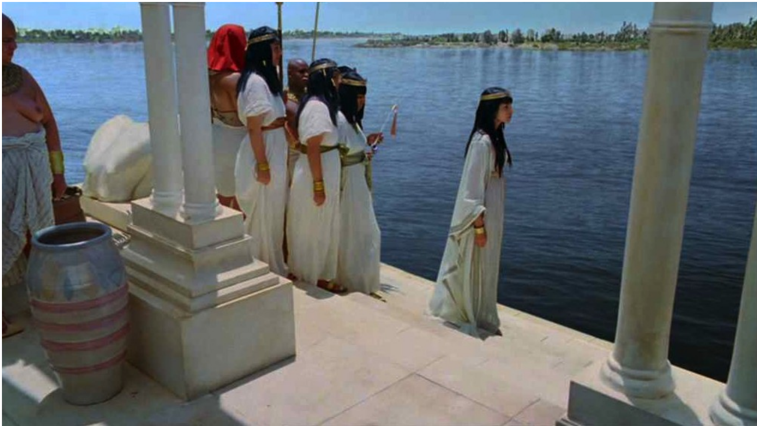
Les Dix Commandements (Dornhelm) : Au bord du Nil, la princesse Bithia aperçut un objet flottant...