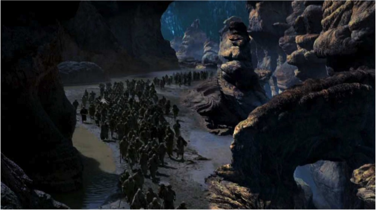
Les Dix Commandements (Dornhelm) : ... pour permettre aux Israélites de passer...