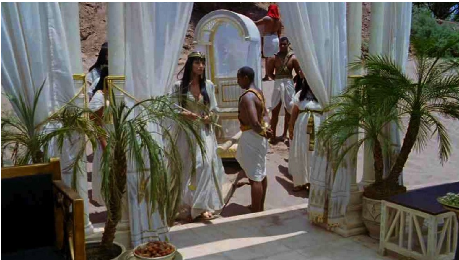
Les Dix Commandements (Dornhelm) : sur ses indications, Bithia fit venir sa chaise à porteurs...