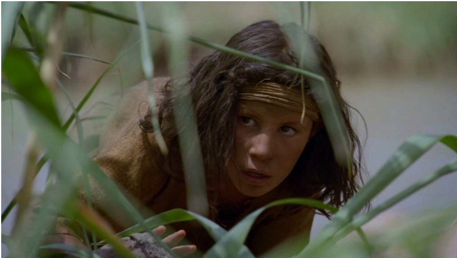
Les Dix Commandements (Dornhelm) : Myriam, la sœur du bébé, avait tout vu ;