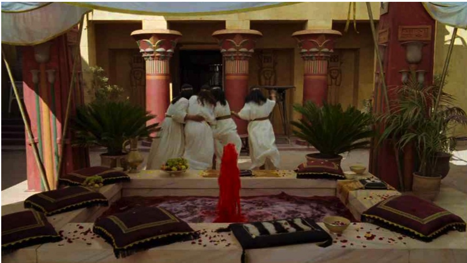
Les Dix Commandements (Dornhelm) : ... jusque dans les fontaines du palais.