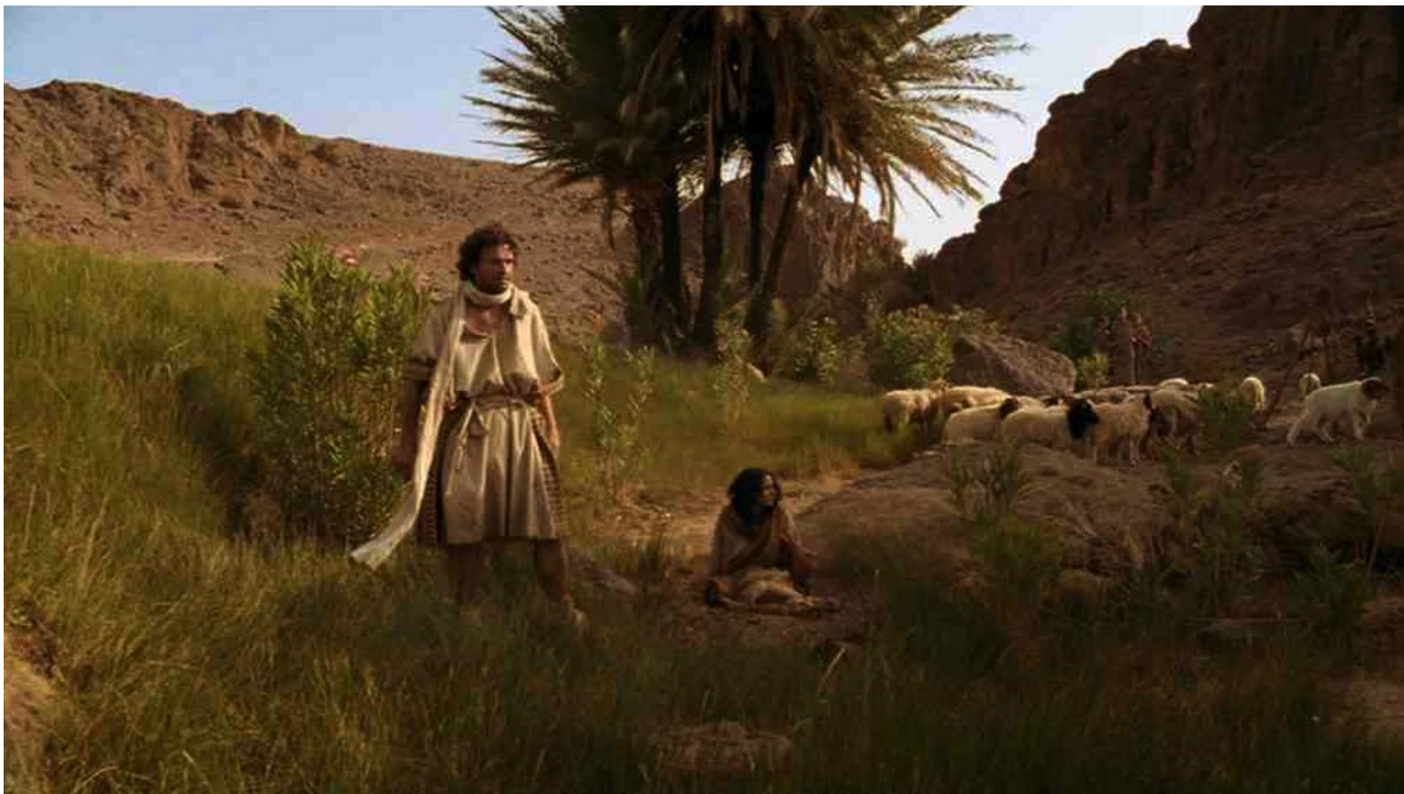
Les Dix Commandements (Dornhelm) : ils menèrent une vie de bergers,