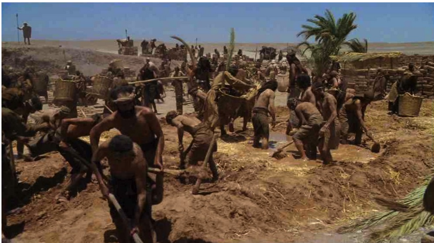
Les Dix Commandements (Dornhelm) : C'était au temps où les Hébreux étaient esclaves en Égypte.