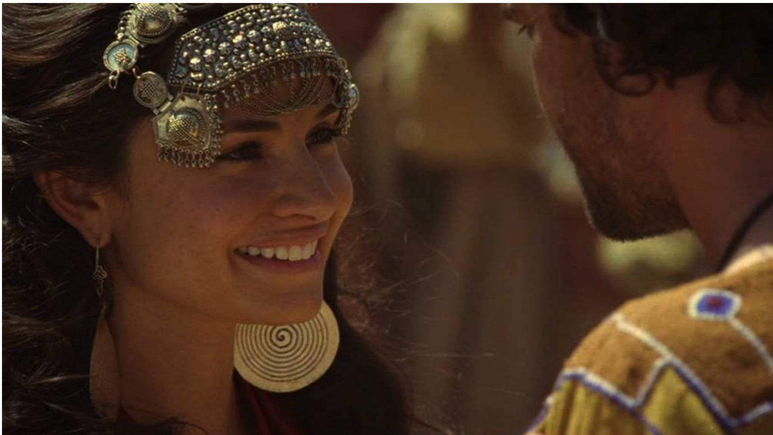
Les Dix Commandements (Dornhelm) : ... pour faire un couple heureux.