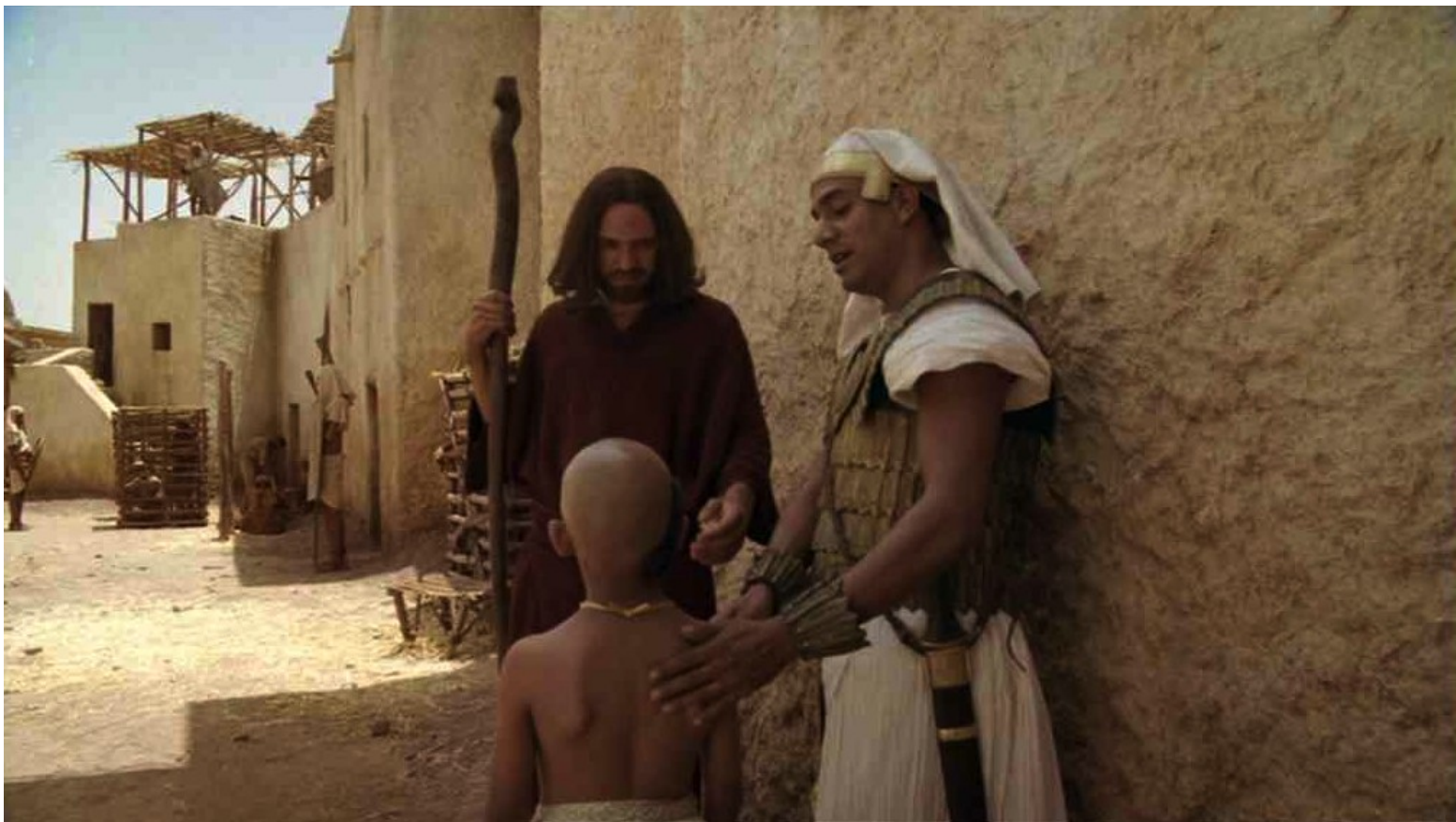
Les Dix Commandements (Dornhelm) : Menerith avait présenté son fils unique à Moïse,