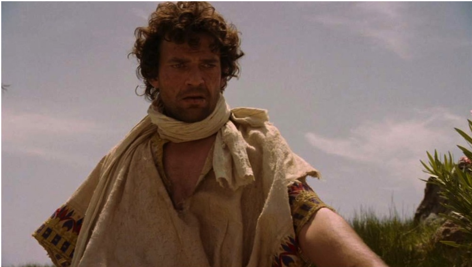
Les Dix Commandements (Dornhelm) : Après une longue errance, arrivé au pied du Mont Horeb,