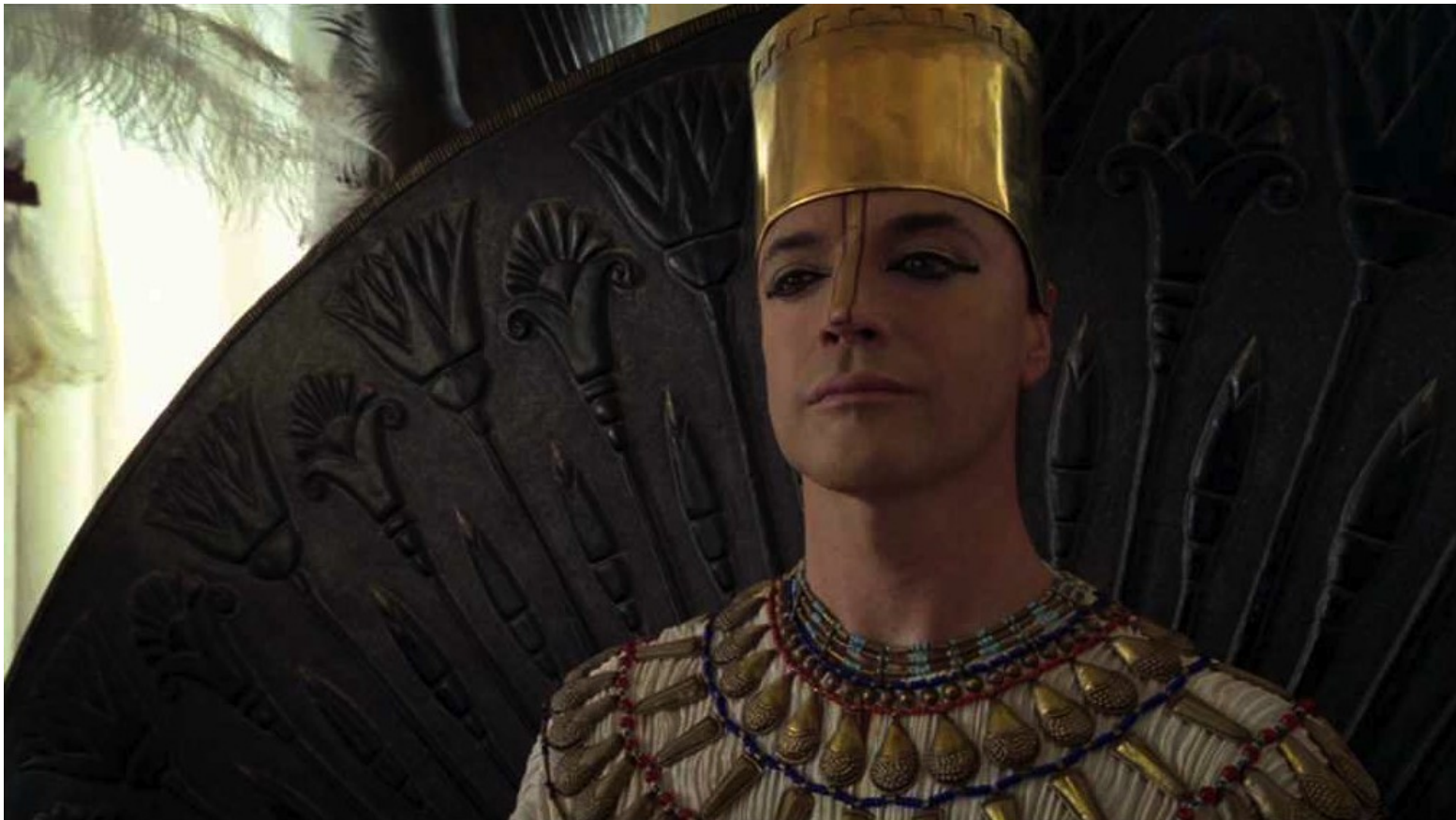
Les Dix Commandements (Dornhelm) : ... et il montra à Pharaon...