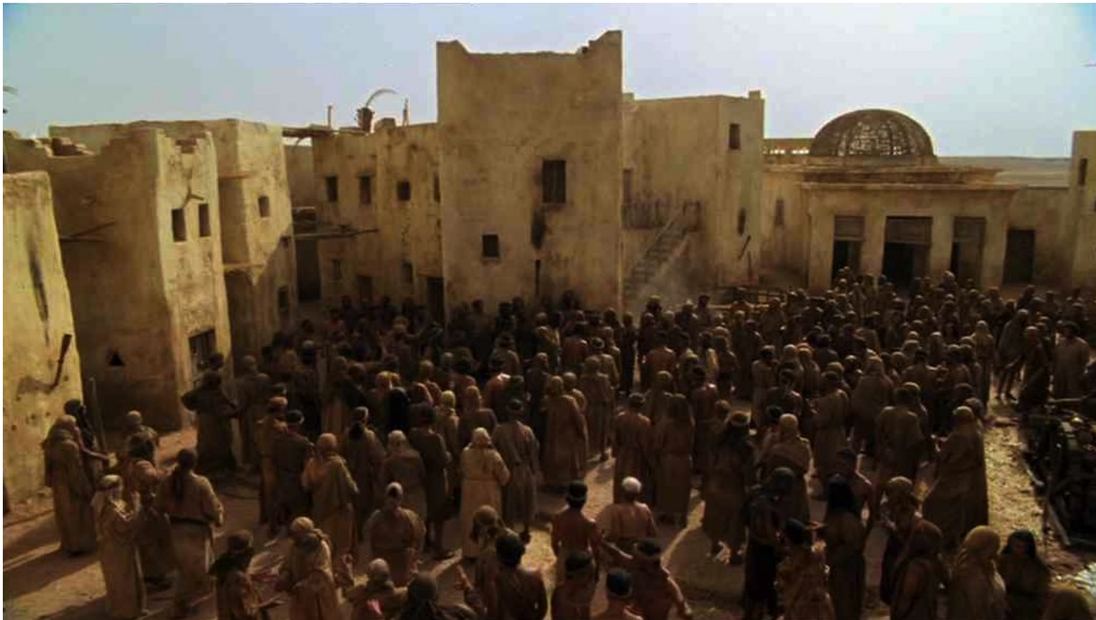
Les Dix Commandements (Dornhelm) : ... et parla aux Hébreux.