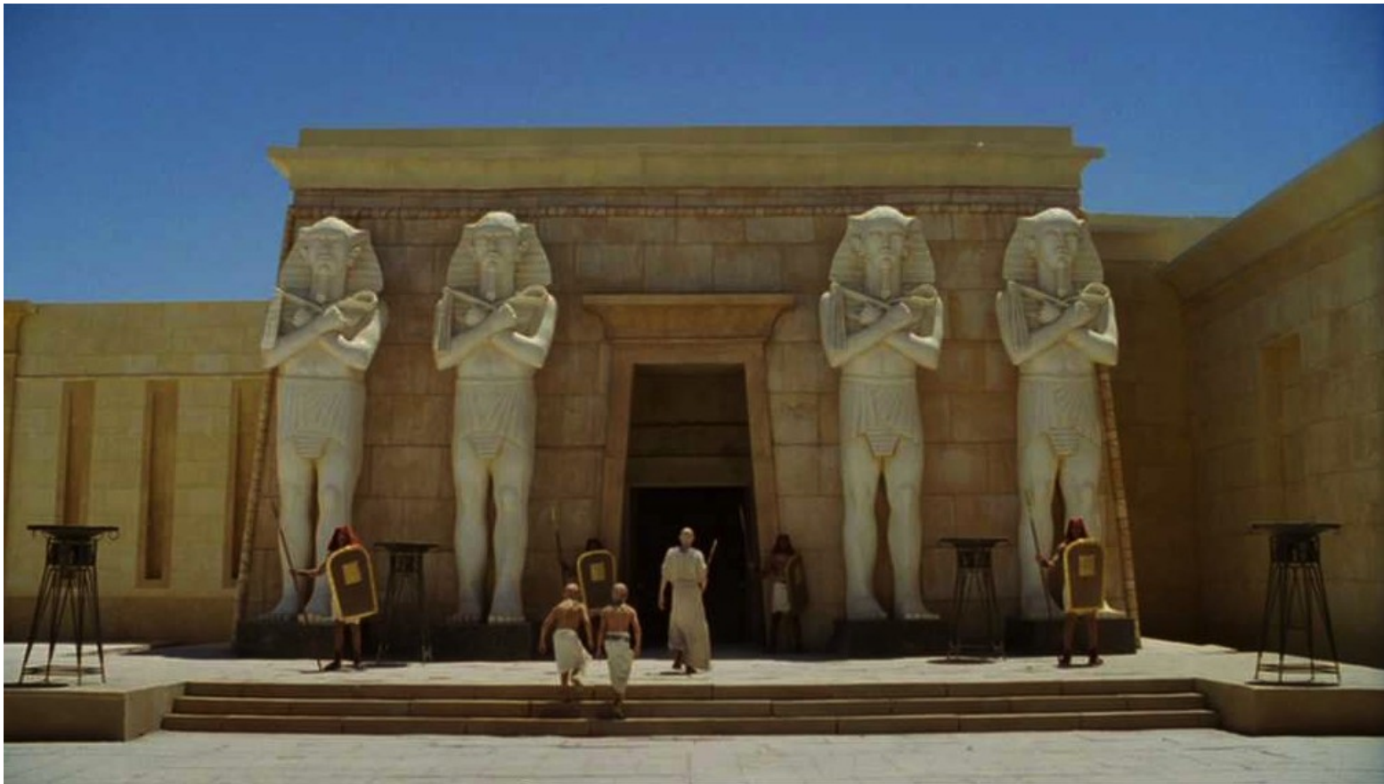
Les Dix Commandements (Dornhelm) : ... dans la religion égyptienne,