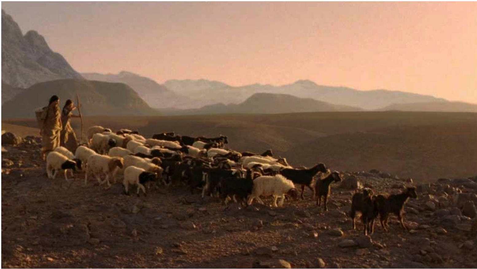
Les Dix Commandements (Dornhelm) : conduisant leur troupeau à la recherche des herbes rares.