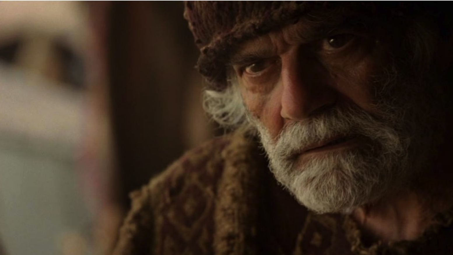
Les Dix Commandements (Dornhelm) : que son père Jéthro...