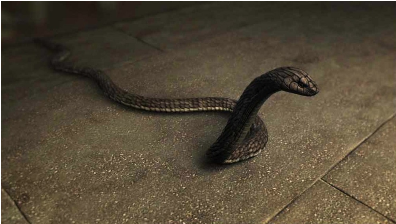
Les Dix Commandements (Dornhelm) : ... comment son bâton devenu cobra pouvait tuer...