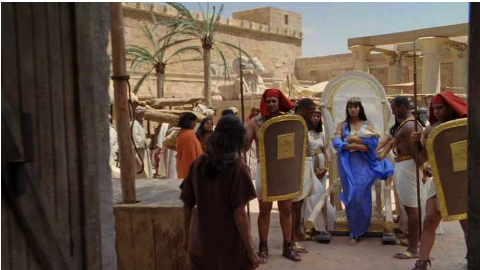
Les Dix Commandements (Dornhelm) : ... pour confier le bébé à une nourrice (dans les faits, sa mère).