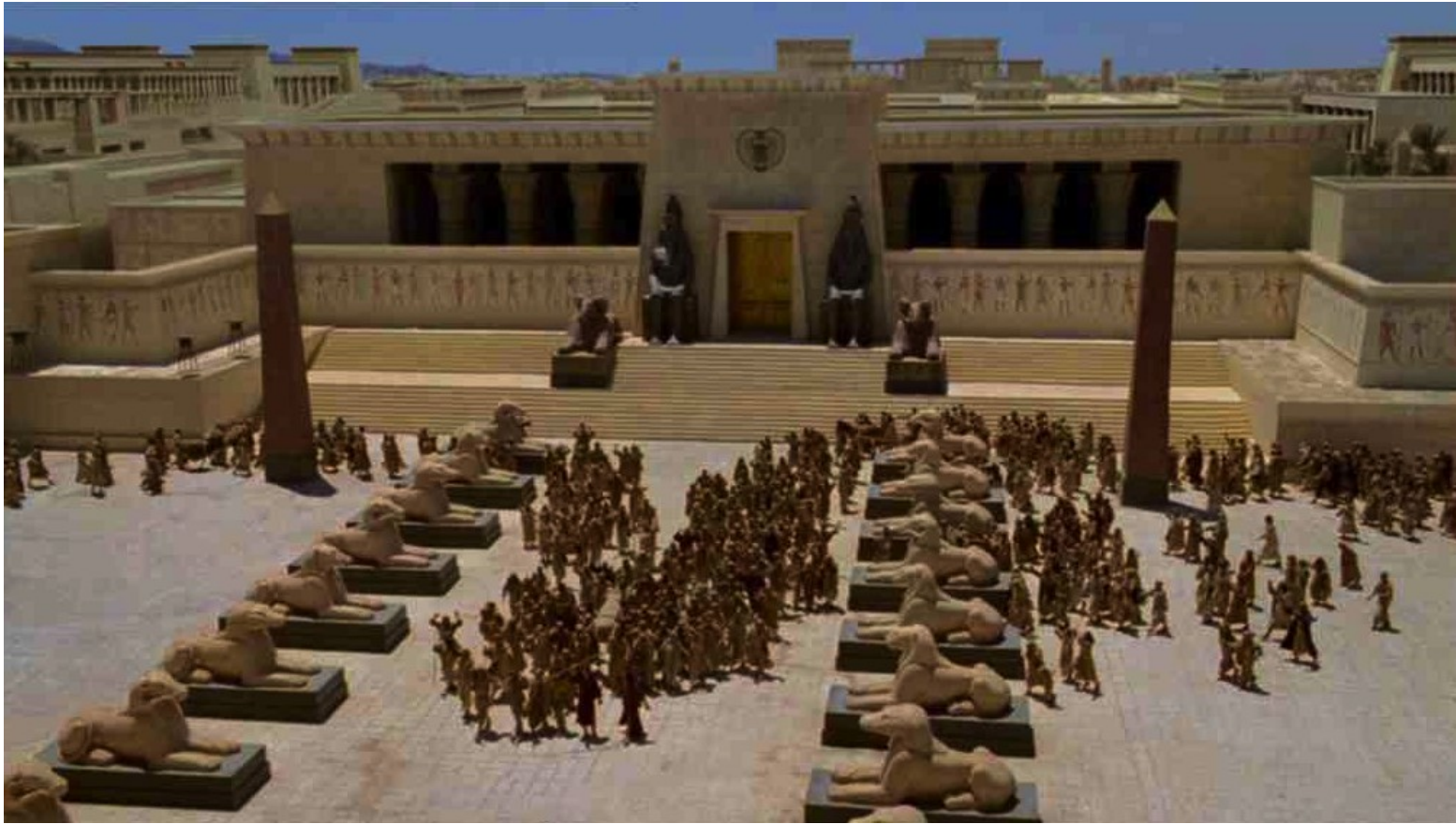
Les Dix Commandements (Dornhelm) : Finalement, Pharaon laissa partir les Hébreux,