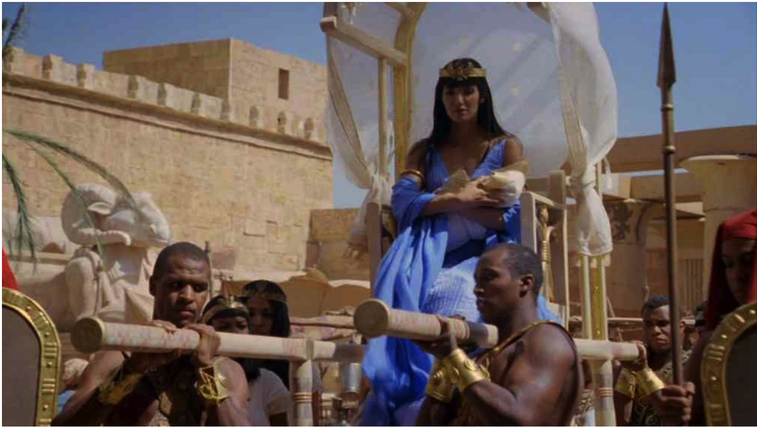
Les Dix Commandements (Dornhelm) : ... et traversa le quartier des Hébreux...