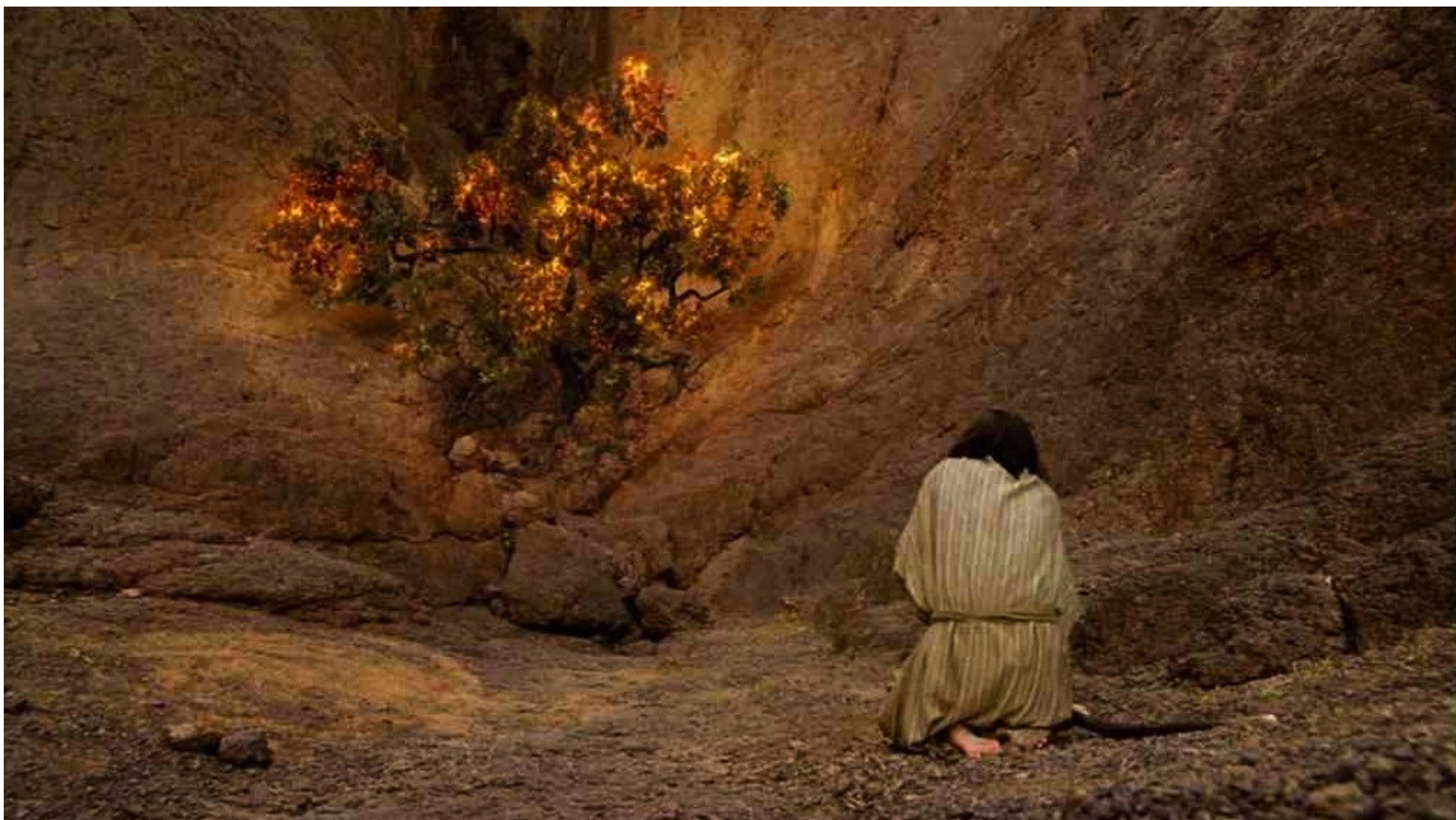
Les Dix Commandements (Dornhelm) : ... qui lui ordonna de demander à Pharaon de libérer les Hébreux.