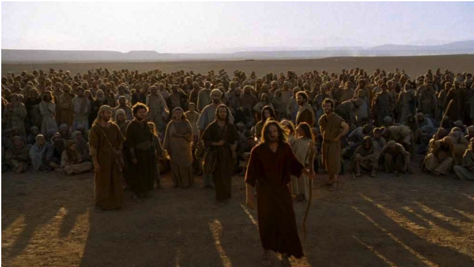
Les Dix Commandements (Dornhelm) : ... sous les ordres de Moïse...