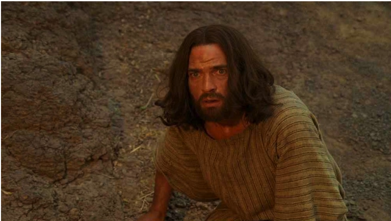
Les Dix Commandements (Dornhelm) : Mais un jour, seul, Moïse vit un phénomène étrange :