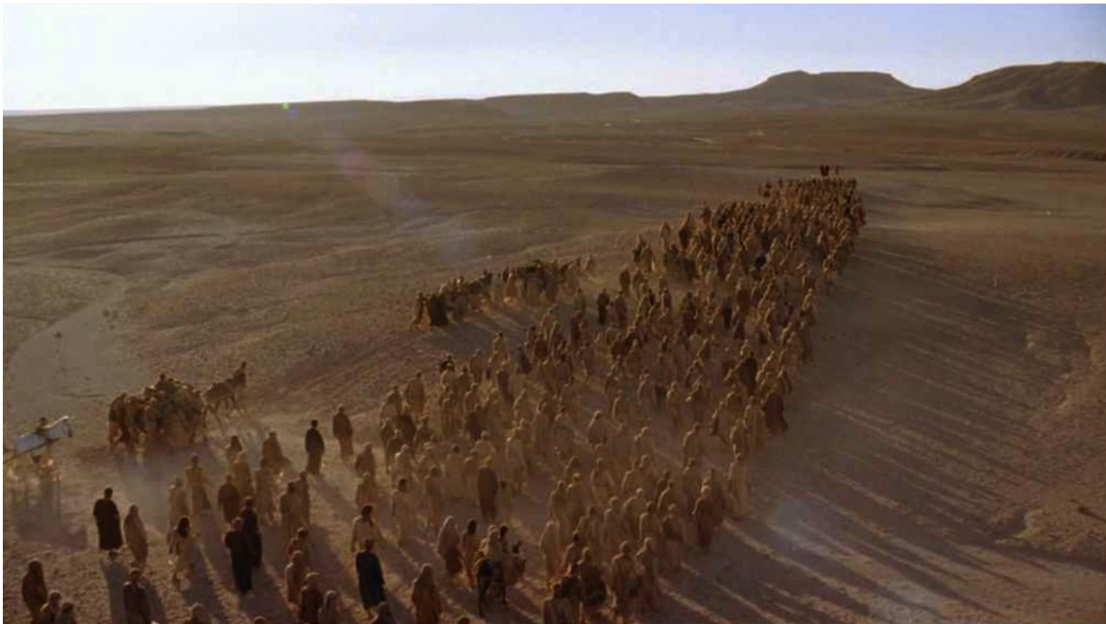
Les Dix Commandements (Dornhelm) : ... et s'engagèrent dans le désert...