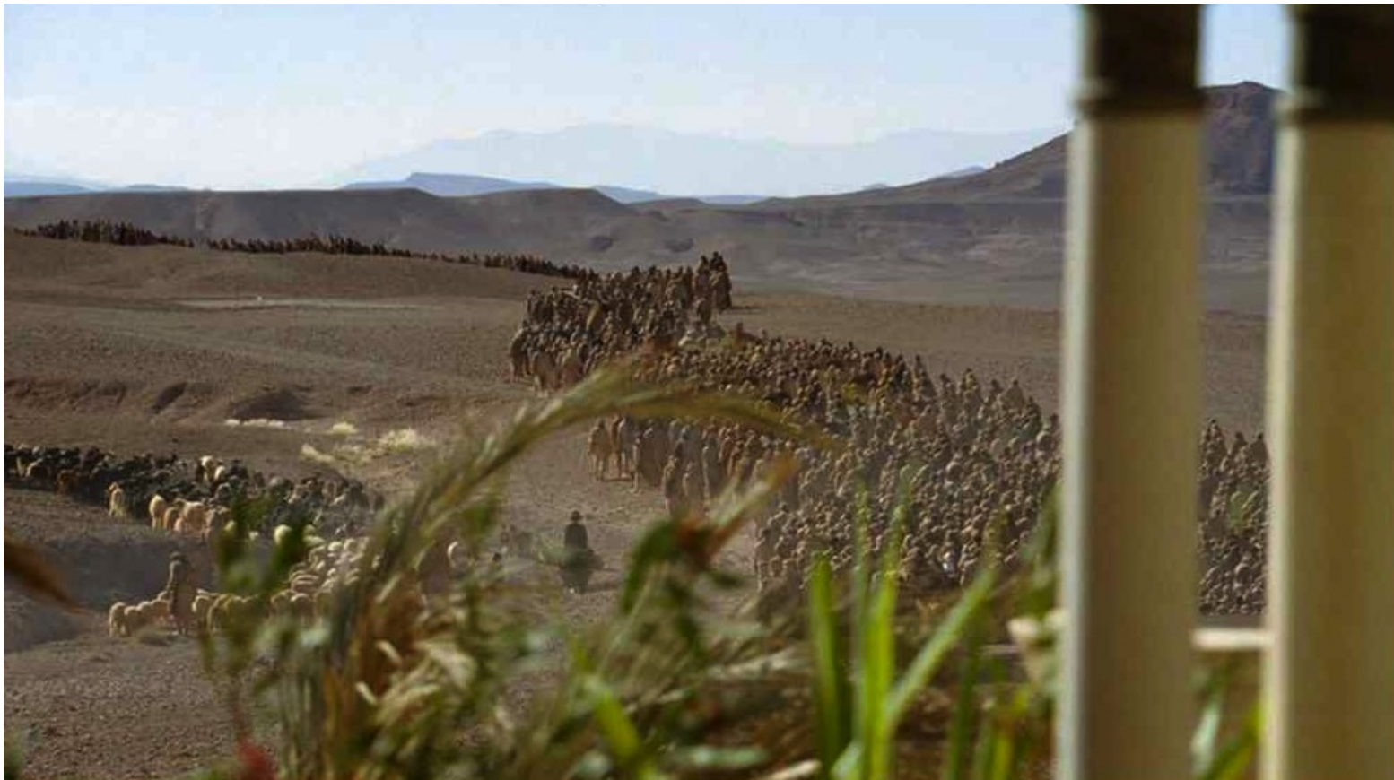
Les Dix Commandements (Dornhelm) : qui sortirent de la ville...