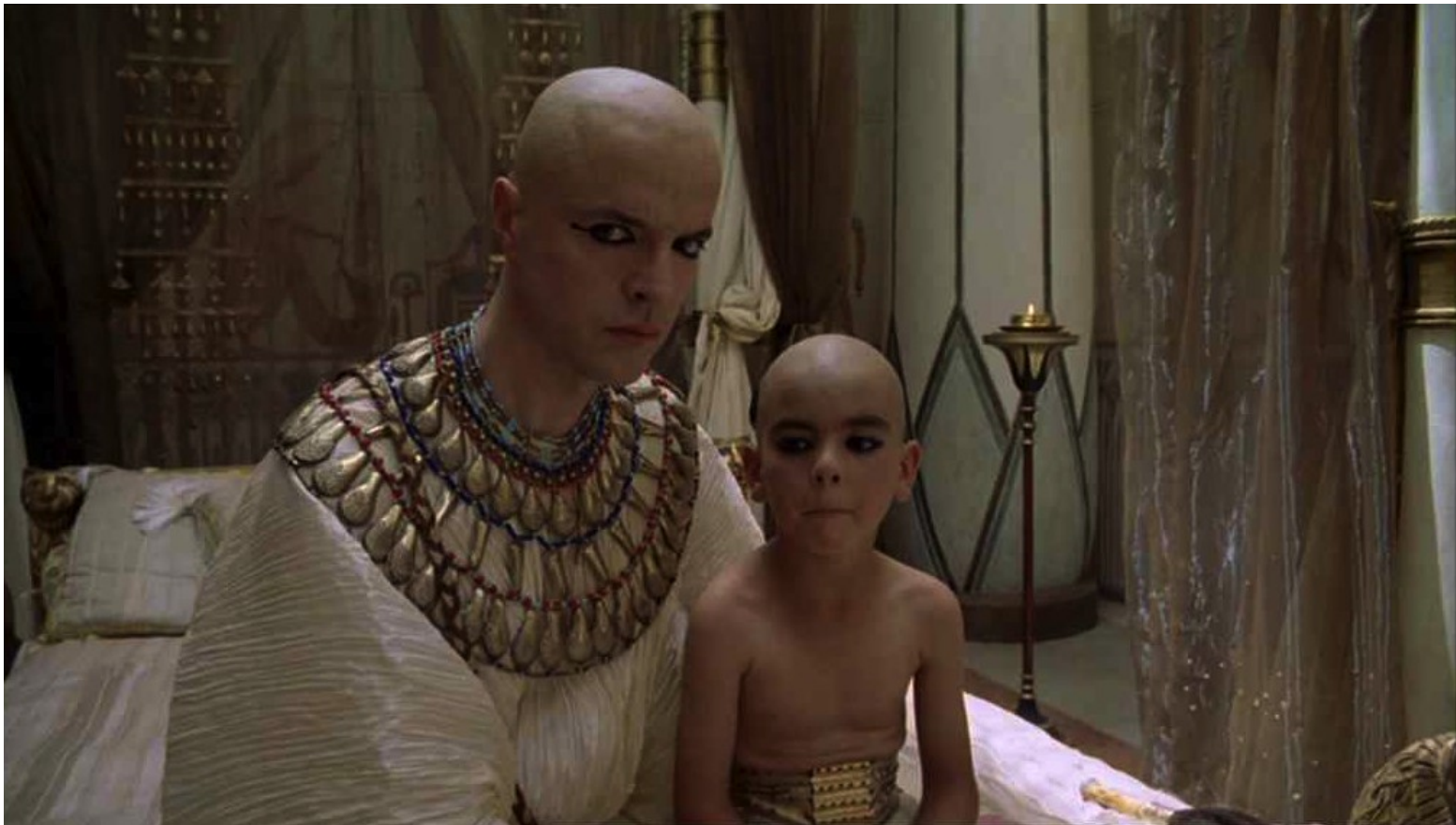
Les Dix Commandements (Dornhelm) : Puis le premier né de Pharaon, qu'il aimait tant, mourut.