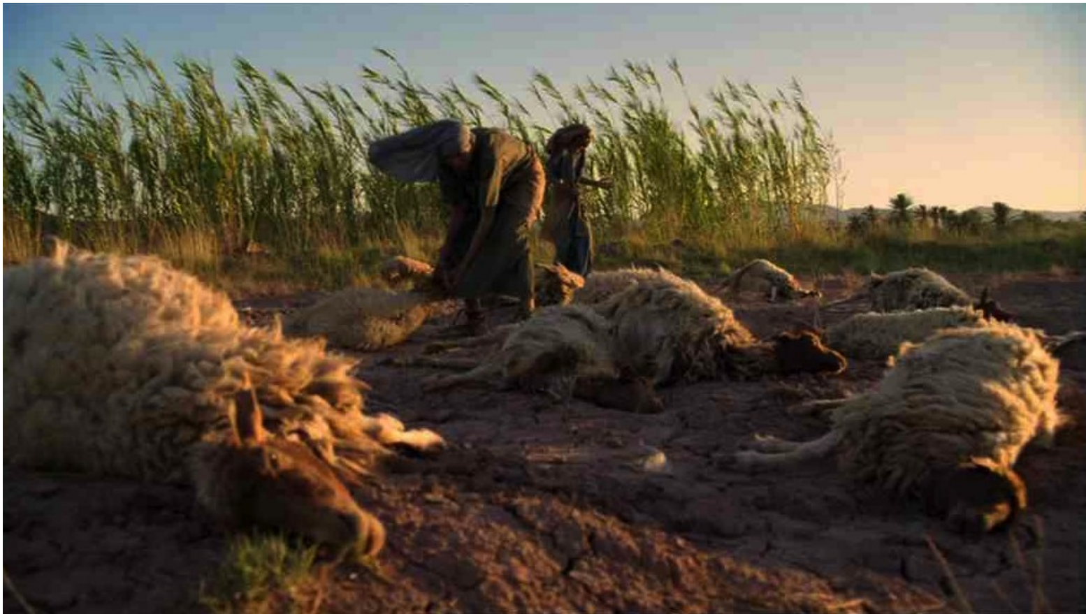
Les Dix Commandements (Dornhelm) : Dès lors des fléaux éclatèrent : les animaux moururent,