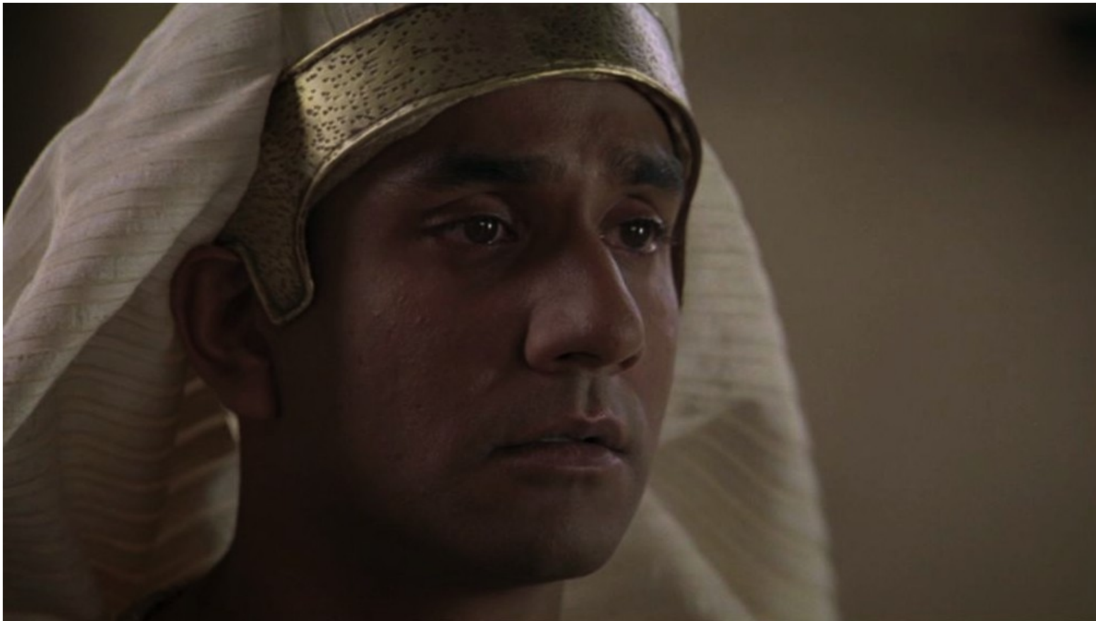
Les Dix Commandements (Dornhelm) : et son frère Menerith, maintenant chef de l'armée égyptienne.